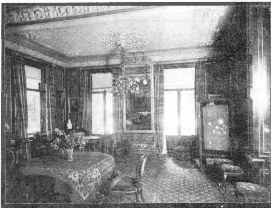
Interieur van één der vertrekken van Heidepark.