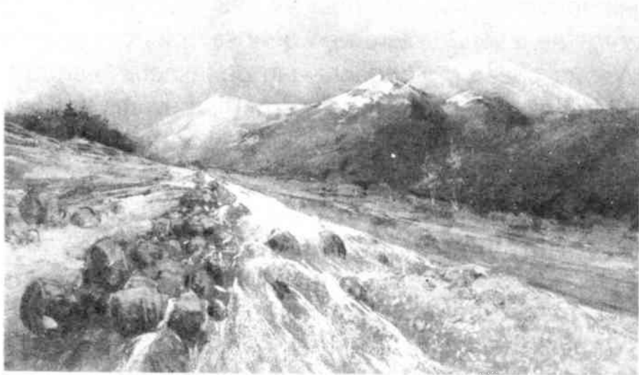
"Gletscherbeek met eindmorene", pastel van Herman Heijenbrock (1935), vervaardigd voor de geologische afdeling van het Gooisch Museum. Koll. Dienst voor Cultuur, Gemeente Hilversum.

De gesprekken tussen Gooisch Museum en Gooisch Natuurreservaat over een samen in te richten museum staan vermoedelijk in verband met de plannen voor een nieuwe huisvesting. In 1941 namelijk had de gemeente Hilversum het voornemen het voormalige raadhuis aan de Kerkbrink af te breken. De stadsarchitect Dudok ontwierp op een terrein