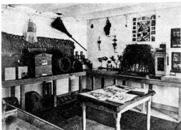
De natuurhistorische afdeling van het Gooisch Museum vlak na de opening. Foto bij het artikel "Het Gooische Museum", Panorama 23 juli 1936, p.11.