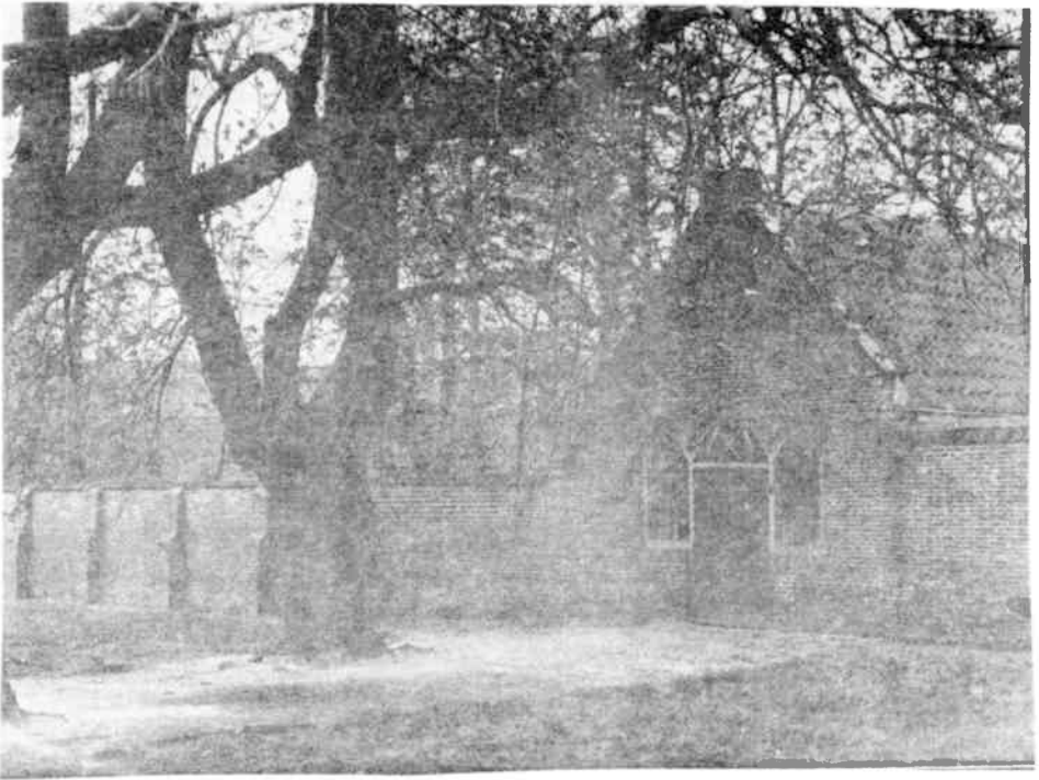
Het "Baarhuisje" dat in 1932 werd afgebroken. (foto Stedebouwkundige dienst; glasnegatief 389 II)

Ook al hebben de ideeën welke Van Ollefen bepleit al lang ingang gevonden, en is de begraafplaats niet meer als zodanig in gebruik, toch kan ook nu dit stille stukje grond midden in het drukke centrum een functie vervullen. Een rustpunt in een dynamisch centrum is een bijzonder bezit, elders gekoesterd, zoals de Begijnhof in Amsterdam, de parken in Stockholm en Cracow. Laten wij ons daarom inzetten voor