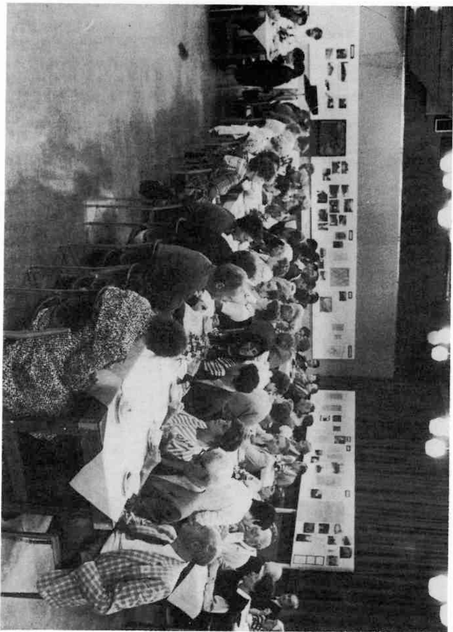
Een overzicht van een historische maaltijd in een eigentijdse omgeving.