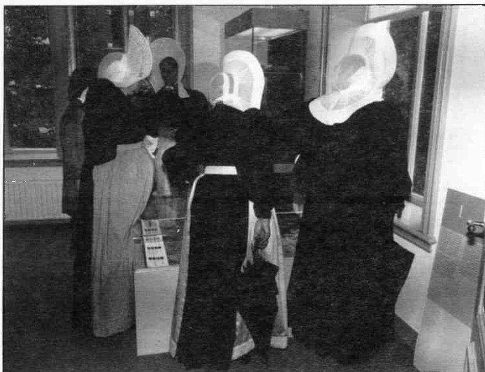
Aandacht voor het buitengebeuren vanuit het Goois Museum van vrouwen in Huizer klederdracht.

In opdracht en met begeleiding van het Goois Museum werd het ontwerp voor de permanente tentoonstelling gemaakt door Tomas Stolk, Pier van Leeuwen en Nils Leloux, studenten van de Reinwardt Academie te Leiden,