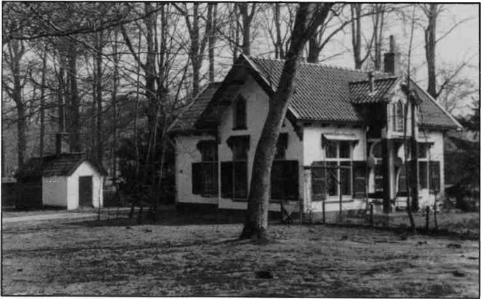
Portierswoning van het buiten Heidepark, thans woning behorende bij Heidehewel