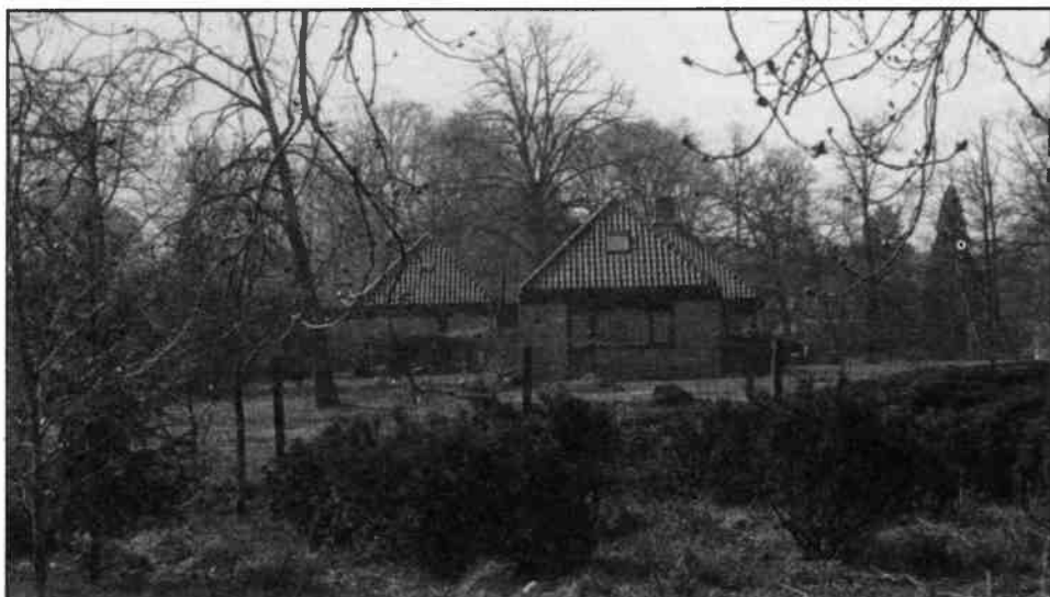
Villa op het voormalige terrein van Heidepark