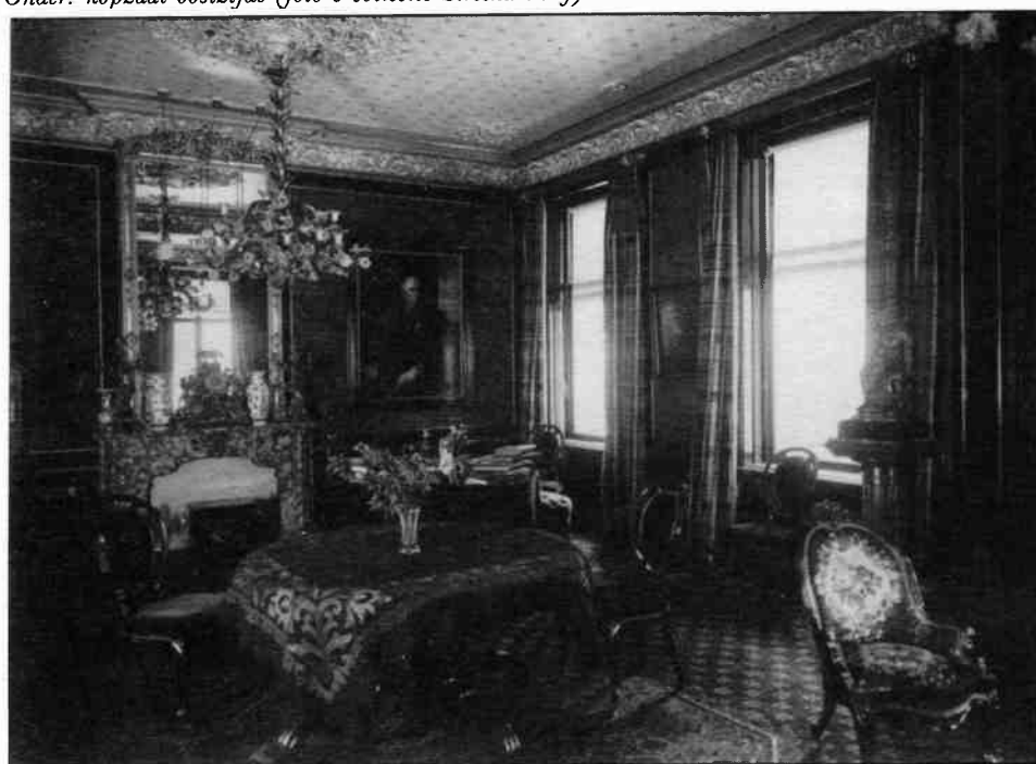
Onder: kopzaal oostzijde