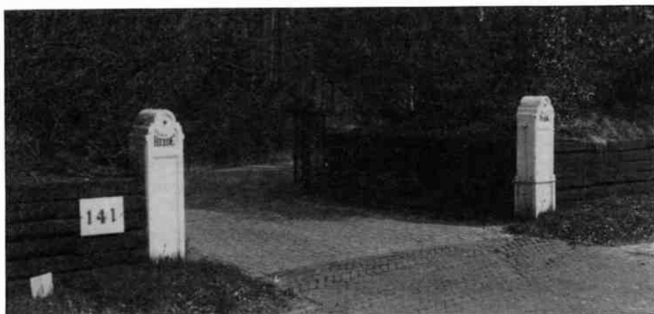
Toegang tot het voormalige buiten, thans toegang tot villa