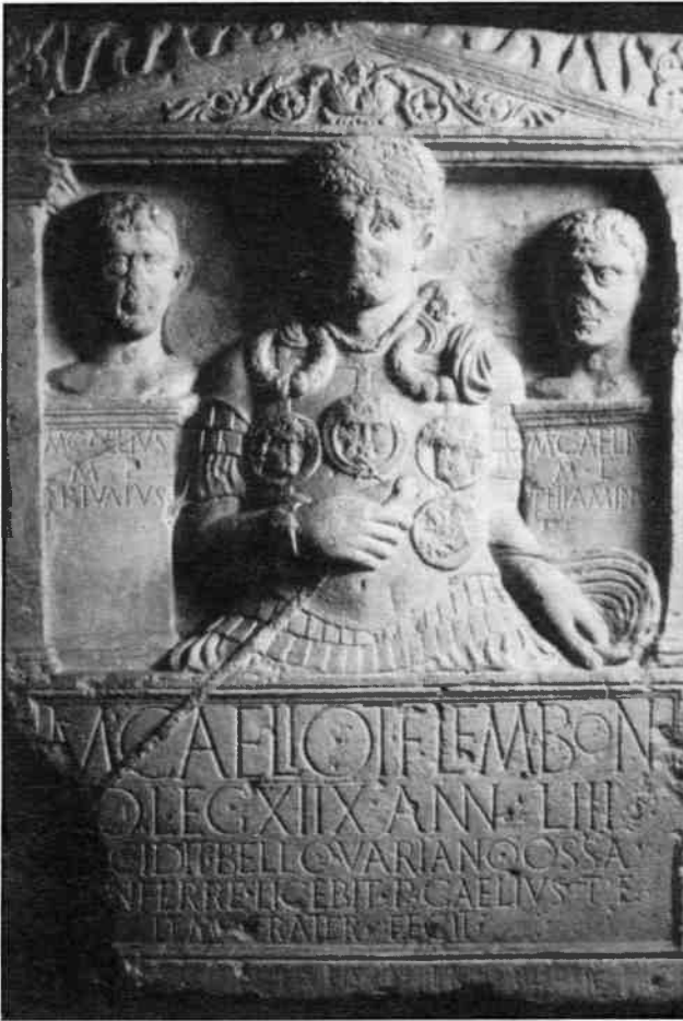
Grafsteen gewijd aan Marcus Caelius, de eerste centurion die sneuvelde in de Varus-slag. Naast schriftelijke overleveringen is deze gedenksteen het enige archeologische bewijs van de slag van Varus (Bello Variano). De figuren links en rechts zijn vrijgelaten slaven van de centurion.

Het huidige park geeft een aardige indruk van de romeinse gebouwen uit de tweede eeuw, zoals het amphitheater, de stadsmuren, de haventempel, de Burginatumpoort en de herberg.