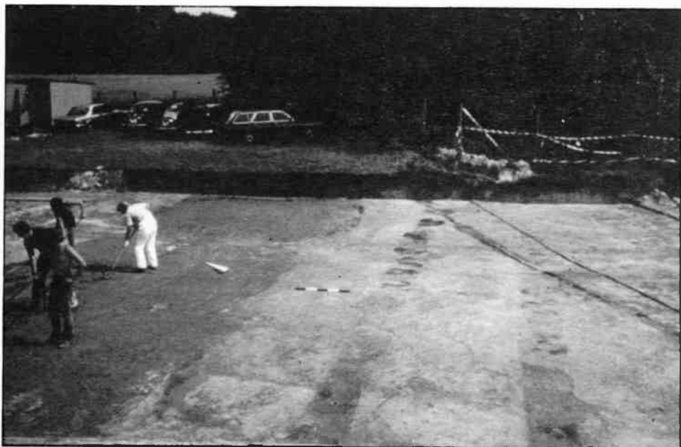
Bij de opgravingen werden verkleuringen in het zand zichtbaar. Aanduidingen van de plaatsen waar de fundamenten (houten balken) van de principia, het militaire hoofdgebouw, moeten hebben gelegen.

gereden. In het Corveyklooster nabij Höxter hebben tot de 30-jarige oorlog een deel van de geschriften (Annalen) van Tacitus gelegen. Na de bezichtiging van het klooster trokken we naar de Externsteine. De Externsteine zijn drie door de natuur gevormde stenen zuilen waarin de Germanen ruimen hebben uitgehakt en deze als heilige plaatsen vereerden. Uiteraard hebben de Romeinen meerdere malen geprobeerd dit germaanse heiligdom te vernietigen, hetgeen hun niet is gelukt.