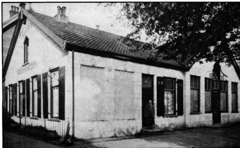
In het gebouw van de H. C. J. M. V. organiseerde een door de Hilversumse protestantse kerken opgericht comité avonden voor Duitse dienstboden. Meer hierover in het volgende artikel.