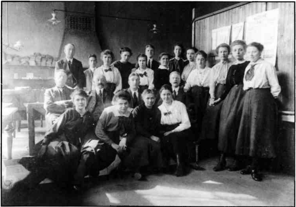
Ambtenaren van de Gemeentearbeidsbeurs van Hilversum. (circa 1930) Uit het jaarverslag van 1924 blijkt, dat in die jaren vrouwelijke ambtenaren aanwezig waren, die zich speciaal met de bemiddeling van vrouwen bezighielden.

in 1924 in het jaarverslag van de Gemeentearbeidsbeurs te Hilversum de terugloop van de Duitse dienstboden medeverantwoordelijk gesteld werd voor de verhoogde plaatsingskans van vrouwen boven de achttien jaar. 10