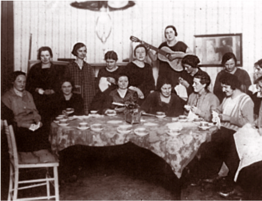
Gezellige avond voor Duitse dienstboden.

versum de terugloop van de Duitse dienstboden meeverantwoordelijk gesteld werd voor de verhoogde plaatsingskans van vrouwen boven de achttien jaar. 10 Blijkbaar speelde de arbeidsmogelijkheid geen doorslaggevende rol in de motivatie van de Duitse dienstboden om naar Hilversum te komen, want hoewel er in 1924 werkgelegenheid voor hen was, gingen de vrouwen toch massaal terug naar Duitsland. De Duitse markt was weer meer waard en meer stabiel en ook politiek kende Duitsland meer rust. De economische en mogelijk ook politieke redenen van de Duitse vrouwen om naar Hilversum te migreren om als dienstbo-