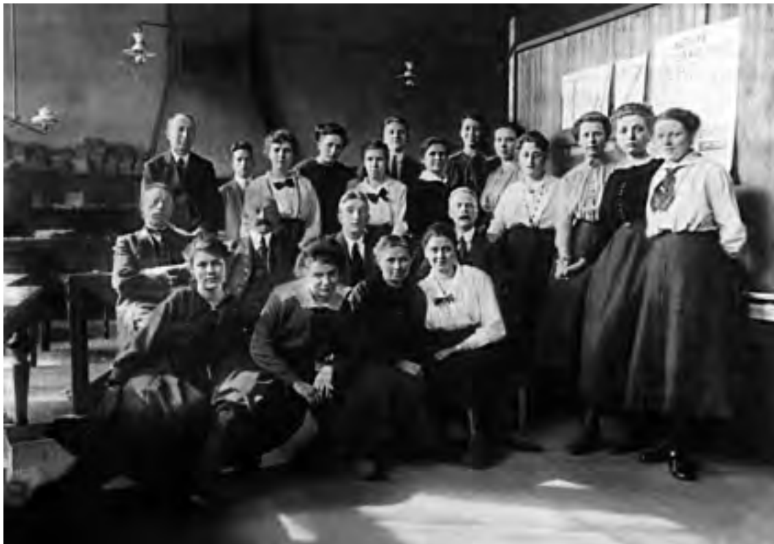
Ambtenaren van de Gemeentearbeidsbeurs van Hilversum (circa 1930). Uit het jaarverslag van 1924 blijkt, dat in die jaren vrouwelijke ambtenaren aanwezig waren die zich speciaal met de bemiddeling van vrouwen bezighielden.

dienstboden wierf. Vermoedelijk liep de bemiddeling van deze vrouwen net als in de rest van Nederland op dat moment. Het grootste deel van de Duitse dienstboden kwam naar Nederland door bemiddeling van familieleden of vriendinnen, die reeds in Nederland in betrekking waren. 11