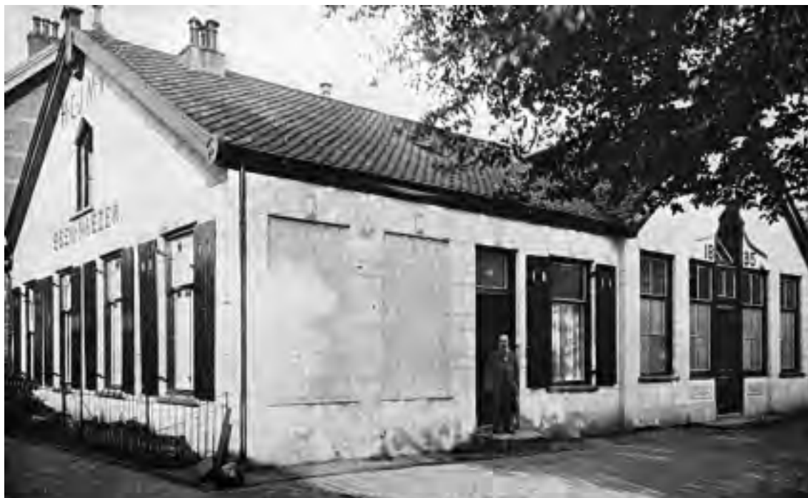
In het gebouw van de H.C.J.M.V. aan het Noordse Bosje organiseerde een door de Hilversumse protestantse kerken opgericht comité avonden voor Duitse dienstboden.

schikten hiervoor over een 'meisjes clubhuis' aan de 's-Gravelandseweg 60 te Hilversum en een 'Tehuis Zusterhulp', welke gevestigd was aan de Torenlaan 1c te Hilversum. Zoals bekend waren in de tijd rond 1925 minder Duitse dienstboden in Hilversum dan in de jaren 1922 en 1923. Het is dan ook niet vreemd om in het jaarverslag van 1926 van deze vrouwenorganisatie te lezen dat er in 1926 minder animo van buitenlandse meisjes was om de voor hen georganiseerde bijeenkomsten te komen bezoeken.