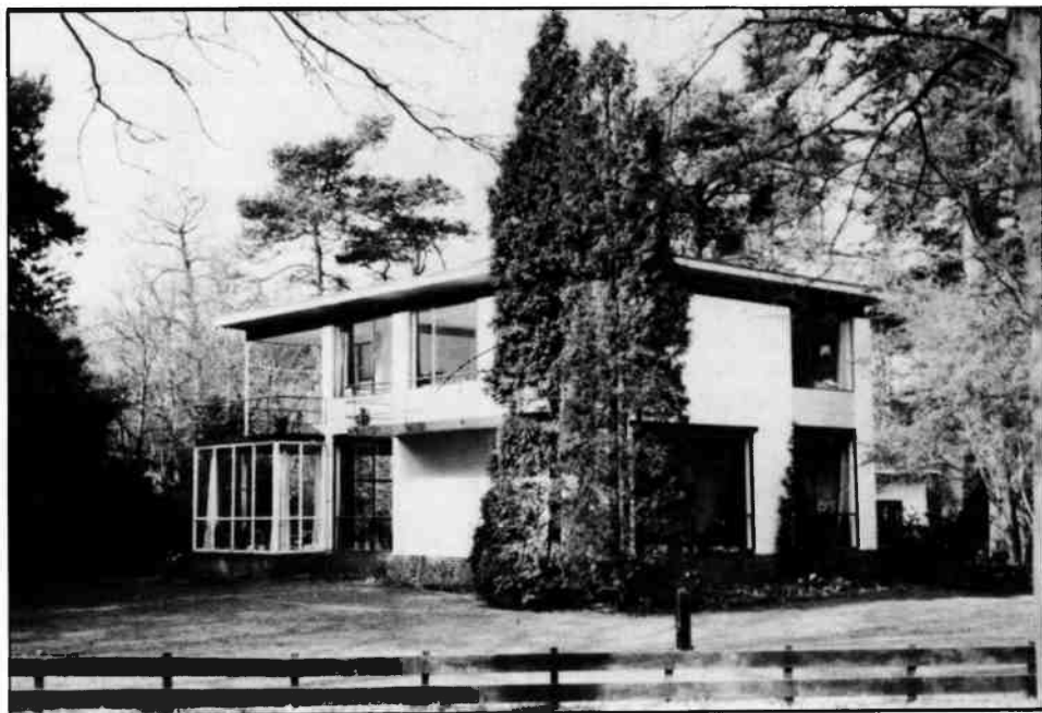
Rossinilaan 11, 1936. De gevels van de villa's uit de 30er jaren zijn niet mee gepleisterd. De bakstenen zijn eenvoudig wit geschilderd. De villa heeft ook grote vensteroppervlakken, hoewel de gevels waarachter de nevenfuncties gesitueerd zijn meer gesloten zijn. De serre, aan de linker zijde, is niet origineel. Oorspronkelijk bevond zich daar een inpandig balkon.

Uit deze villa's uit 1929 en 1930 blijkt dat Elling nog aan het experimenteren was met materialen en technieken. Het dakterras aan de Hertog Hendriklaan heeft in de