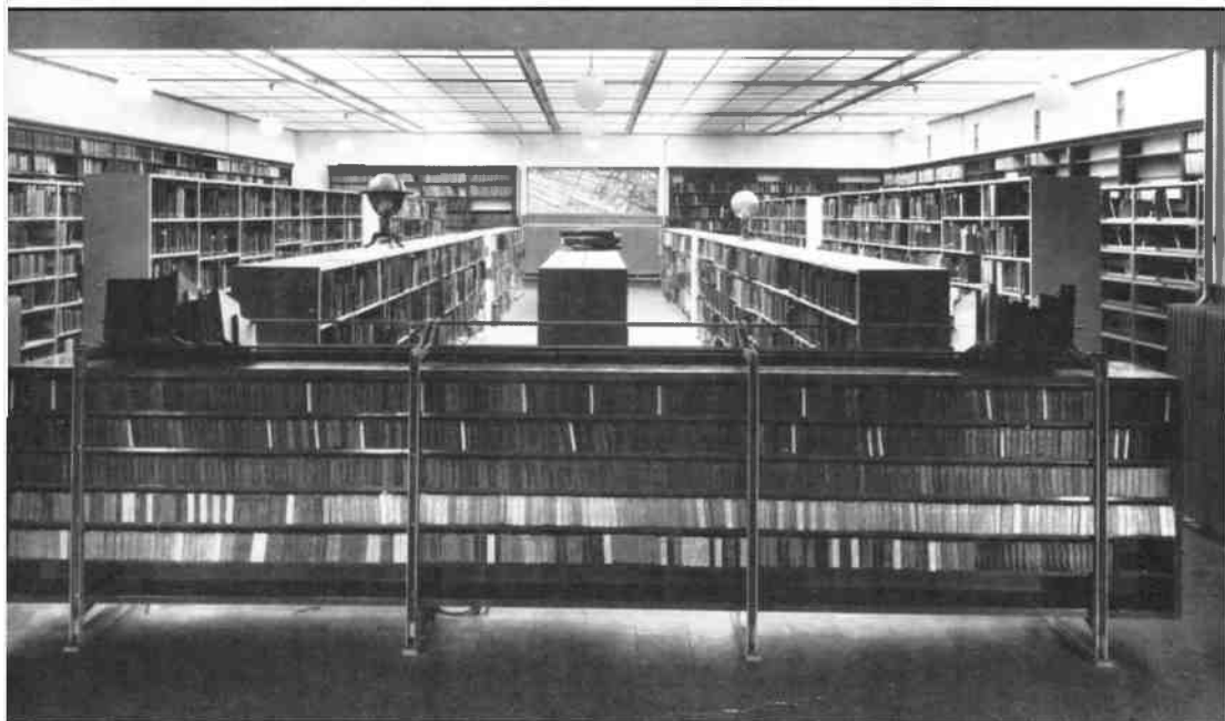
Het interieur van de Openbare Leeszaal en Bibliotheek aan de 's-Gravelandseweg 55 bij de opening in 1933. Het glas-in-lood raam achterin de boekerij liet op dat moment het daglicht door. Bij latere aanbouw ging dit effect verloren.