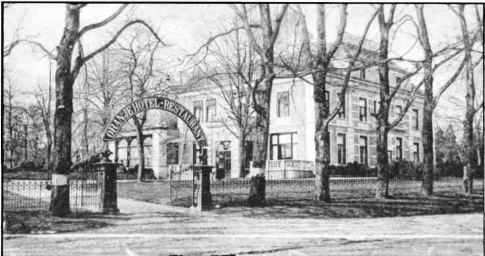
Het Oranje Hotel-Restaurant rond de eeuwwisseling. De Oranjerie die aan de achterzijde werd aangebouwd is op de foto goed te zien. De warandes zijn hier nog niet veranderd in serres (vergelijk de foto op de voorpagina van dit nummer).