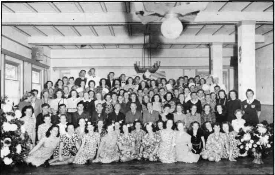
Na het vertrek van de Canadezen kwam het personeel van de Maple Leaf Club na Kerstmis 1945 nog een keer bij elkaar in de eetzaal van de club – de huidige leenzaal – om afscheid te nemen.