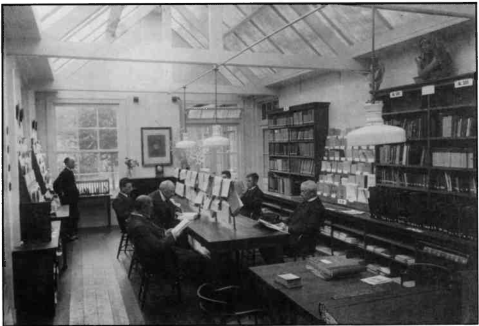
Een kijkje in de leeszaal van de bibliotheek aan de Heerenstraat voor 1933. Werden de dames wellicht door de straatnaam afgeschrikt?

Haar overlijden in maart 1932 is aanleiding voor de verkoop van het pand. Voor f 32.000 wordt het bestuur van de Openbare Leeszaal en Bibliotheek de nieuwe eigenaar. De akte passeert op 2 januari 1933.