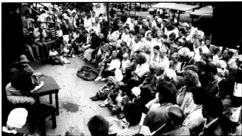
Grote publieke belangstelling bij de opvoering van het middeleeuwse wagenspel 'Toe maar' door de speelgroep Filiassi tijdens de open dag van het Goois Museum.