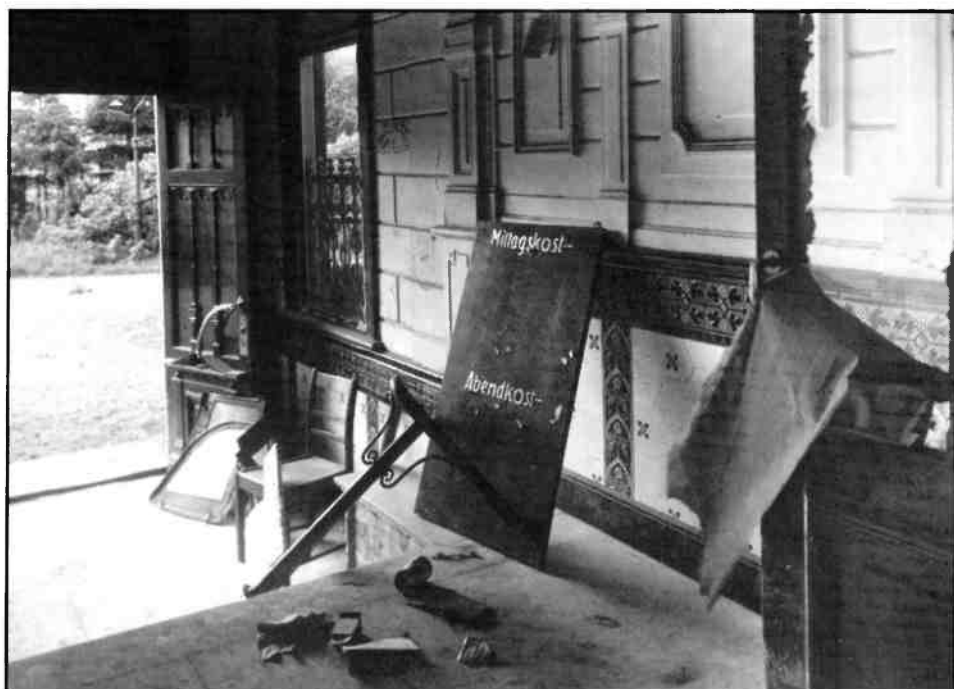
Foto onder: De entree aan de zuidzijde. Het bord is een stille getuige van de verdwenen bezetter.

Foto boven: het toegangshek met doorkijk op de AVRO-studio.