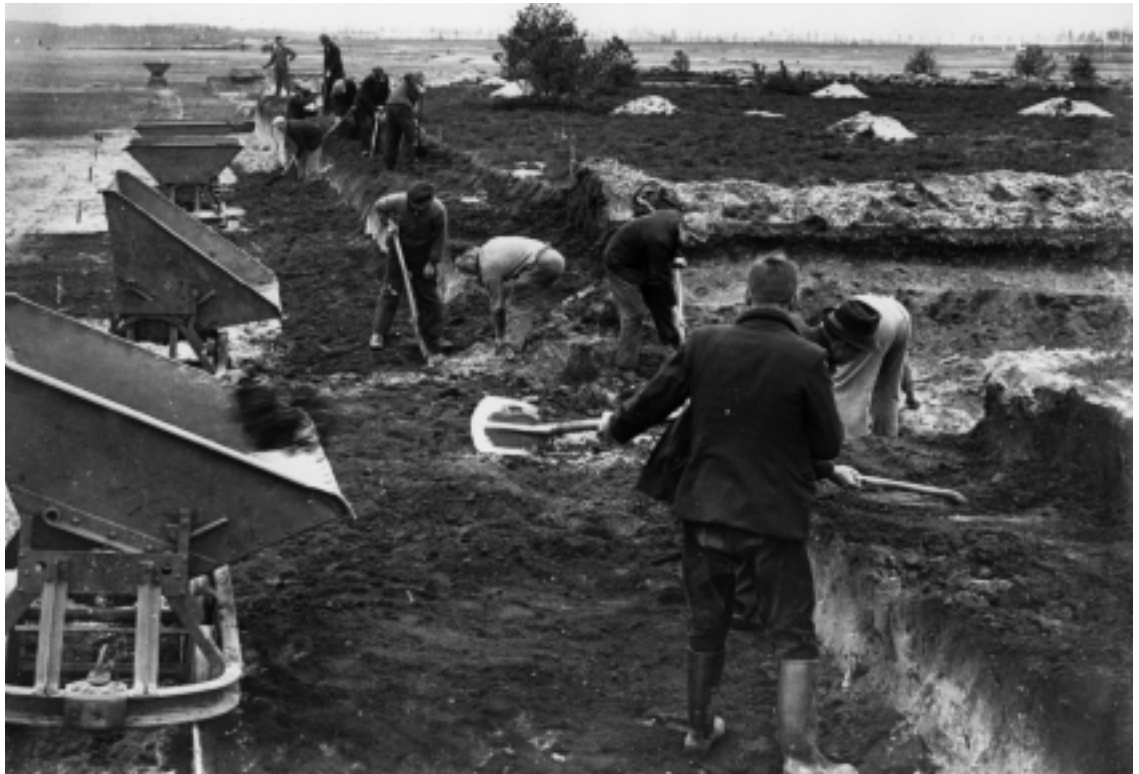
De aanleg van Vliegveld Hilversum in de Crisistijd vond plaats in het kader van de werkverschaffing.

invoering van de z.g. “verkorte tewerkstelling” moest men eerder wisselen van werkploeg, juist wanneer men met die oude ploeg was ingewerkt. De maatregel leidde dan ook tot kredietoverschrijding.