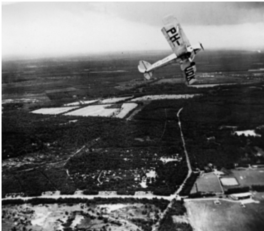
Een Tiger Moth van de Nationale Luchtvaart School (NLS) boven Vliegveld Hilversum (rechtsonder), eind jaren '40.

Tijdens de nadagen van de oorlog, probeerden de Duitsers gebouwen en materialen onklaar te maken. Na de bevrijding konden de geallieerden het vliegveld evenwel toch nog gebruiken. Op 1 juni 1945 kwam het Engelse hoofdkwartier van het 657 (Army) squadron met Auster AOP.5-vliegtuigen naar het vliegveld. Deze eenheid zorgde voor steun aan het Canadese leger. De Austers bleven echter maar zeer kort. Al op 20 juni 1945 verhuisde de eenheid, over de weg en niet door de lucht, naar Goslar (Duitsland). De laatste geallieerden gebruikten het vliegveld of gebouwen nog tot januari 1946.