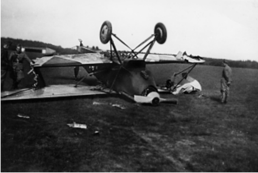
Een dag voor het uitbreken van de oorlog, 9 mei 1940, ‘capoteerde’ – een vliegers-term voor over de kop slaan – deze Fokker C.5 van de 1e Verkenningsgroep.