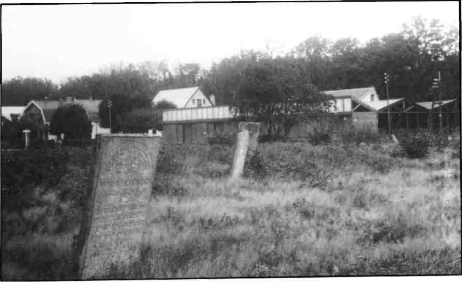
Het gebouw van de 'Coöperatieve Veilingvereniging Hilversum en Omstreken' gezien vanaf het voormalige Israëlitische Kerkhof aan de overkant van de Vaart, waar nu de Nieuwe Havenweg loopt. De foto werd ca. 1930 genomen.