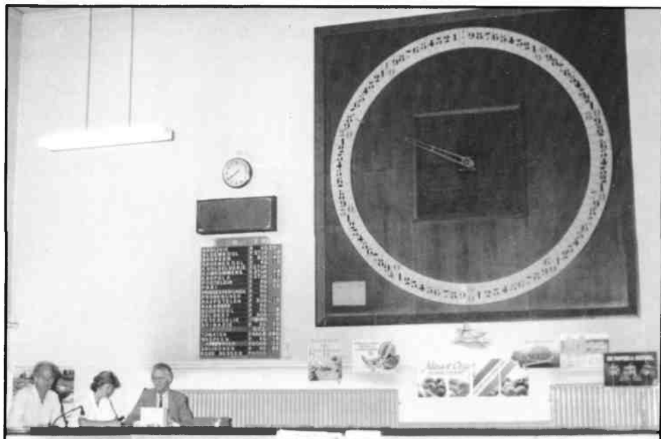
De klok in het veilinggebouw. Geheel links de heer Nouwt de laatste afslager en voorzitter van de veilingvereniging.

Verder verdween veel tuinbouwgrond wegens uitbreiding van de woningbouw in de gemeenten.