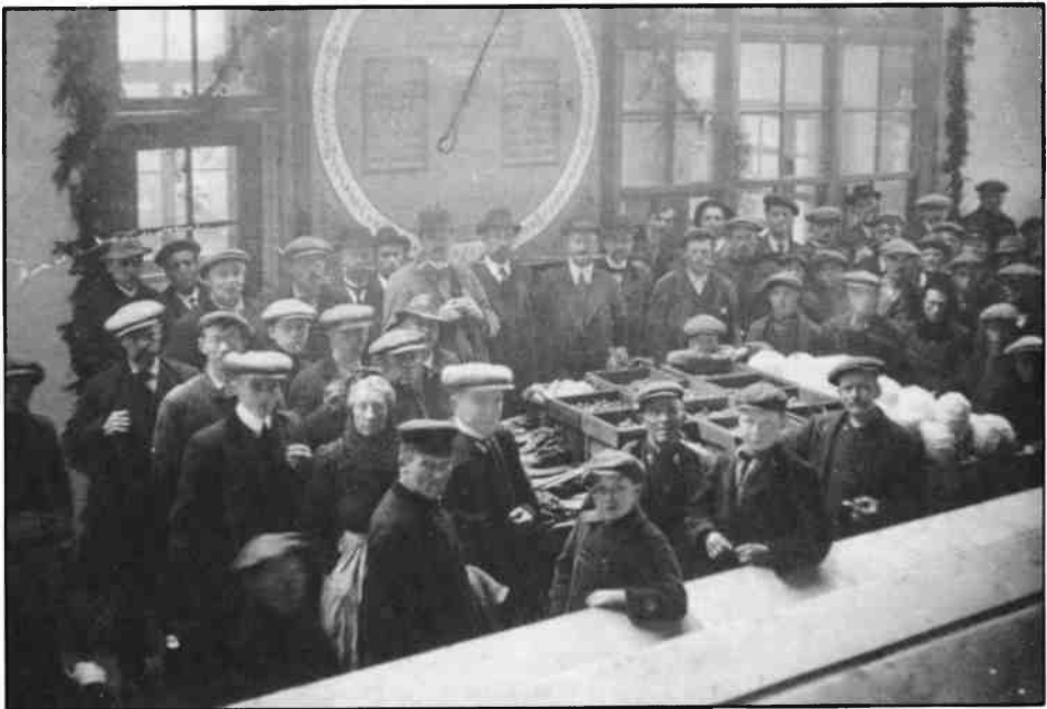
De eerste groenteveiling in het nieuwe gebouw aan de Berensteinseweg vond nog in 1913 plaats. De elektrische klok was voor die tijd zeer modern.

Verder zeggen ze per 1 januari 1914 de huur op van het veilingterrein aan de oude loswal en bedanken zij namens de Hilversumse veiling de gemeente Hilversum voor de daar genoten gastvrijheid. Het gebouw aan de Berensteinseweg kwam er in 1913 dank zij de stuwende kracht van D.O. en zijn bestuur. Hij heeft ook zijn best gedaan