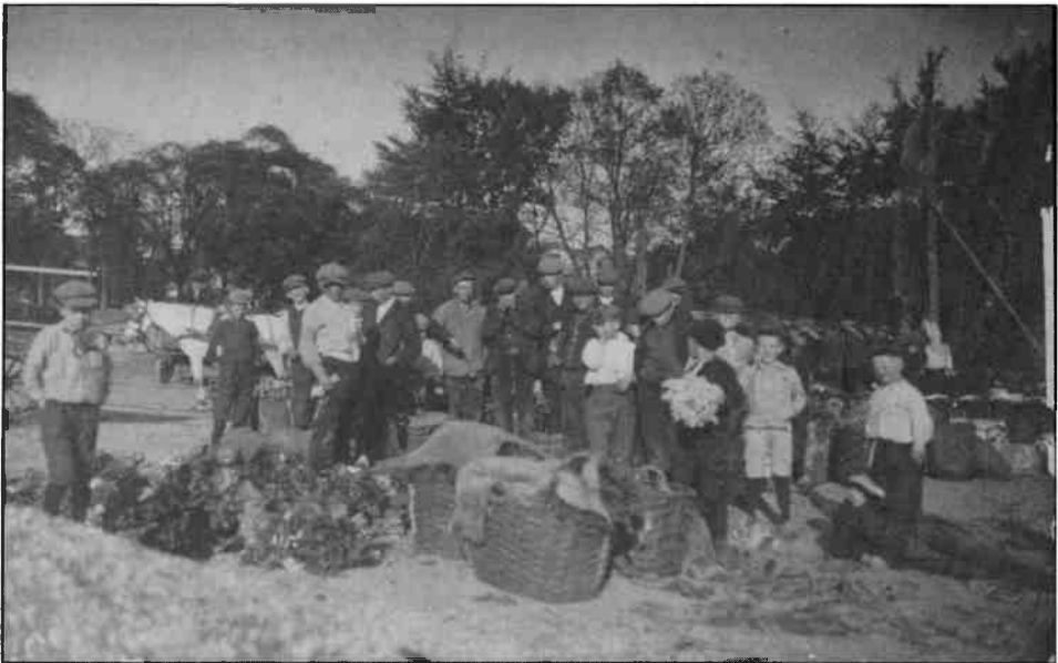
Rond 1912 vond de uitwisseling van groenten en bloemen van de tuinders aan de detailhandel plaats in de open lucht. De foto is vermoedelijk gemaakt dichtbij Café Dekker bij de Hondebrug.

Ruim 100 jaar geleden had men nog nooit van een veiling gehoord. In tuinbouwgebieden in Noord-Hollands zoals de Streek, Bangert, Langedijk en Kennemerland, werd toen al groente en fruit geteelt. De beurtschippers die toen voeren naar Amsterdam en Haarlem kregen deze produkten in 'consignatie' mee, met andere woorden de vrijheid om er een hoog mogelijke prijs voor te ontvangen. Was het produkt 'graag'