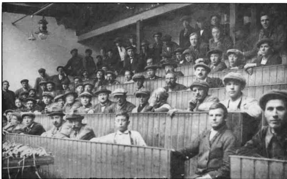
De handelaars bij de eerste groenteveiling in 1913 in de banken van waaruit ze de klok konden stilzetten. De enige vrouw op de foto had wat moeite met de fotograaf.

voor een nieuwe beschoeiing aan de vaartkant voor het lossen der schuiten en voor de aanleg van rails voor het af- en aanrijden van rollende presenteertafels naar het veilinggebouw.