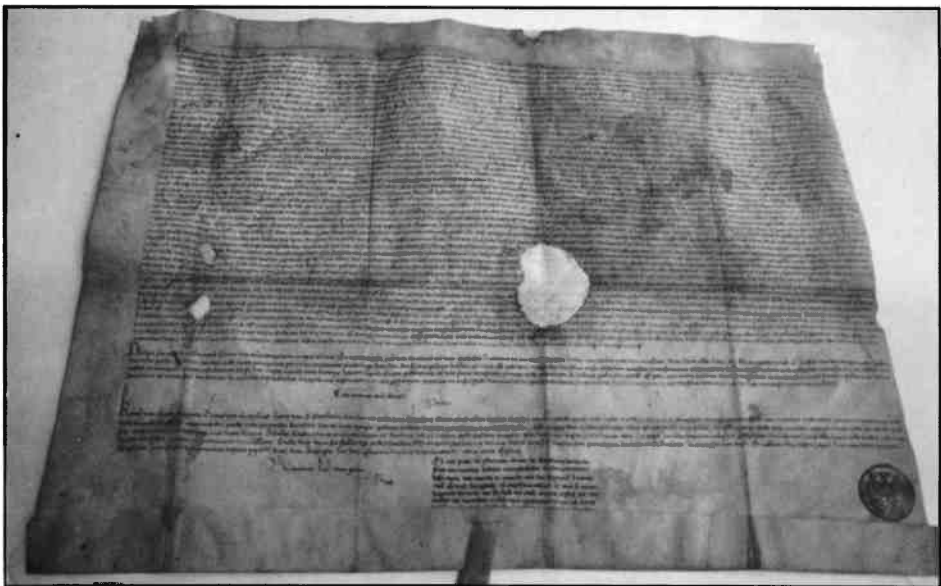
De eerste schaarbrief van 1404, volgens afschrift uit 1470 (coll. Staden Lande Stichting). In de schaarbrieven werden de voorwaarden vastgelegd tot het gebruik van meentweide, heide en veen. De 'schaar' hield de toelaatbare hoeveelheid vee in dat per gezin op de 'Gemeente' mocht grazen.

De sociale structuur van de typische es- of engdorpen wordt wel aangeduid als 'esgenootschap'. Functioneel gezien is het esdorp een typisch markedorp. Het bouwland op de eng was in principe particulier bezit, waar de 'gemeente' in gezamenlijk gebruik