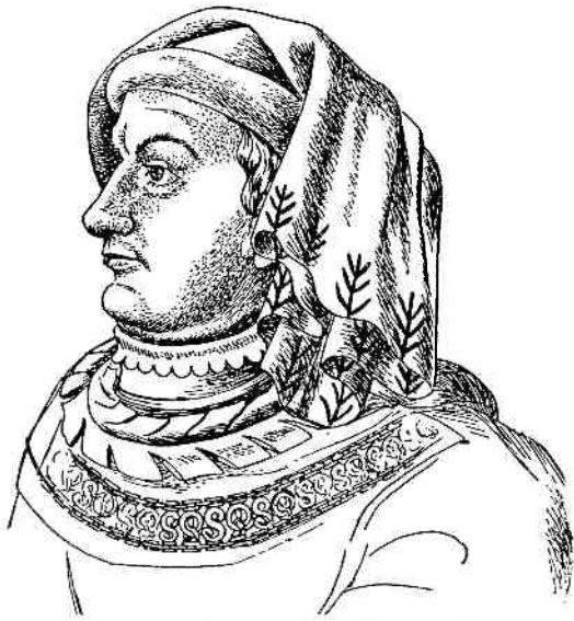
Jan van Beieren. Tekening uit de 'Recueil d'Arras' (16e eeuw). Gemeentebibliotheek Atrecht.

Overijsselaars overvielen Hollandse schepen op de Zuiderzee, terwijl de Brabanders de handel met Vlaanderen bemoeilijkten.