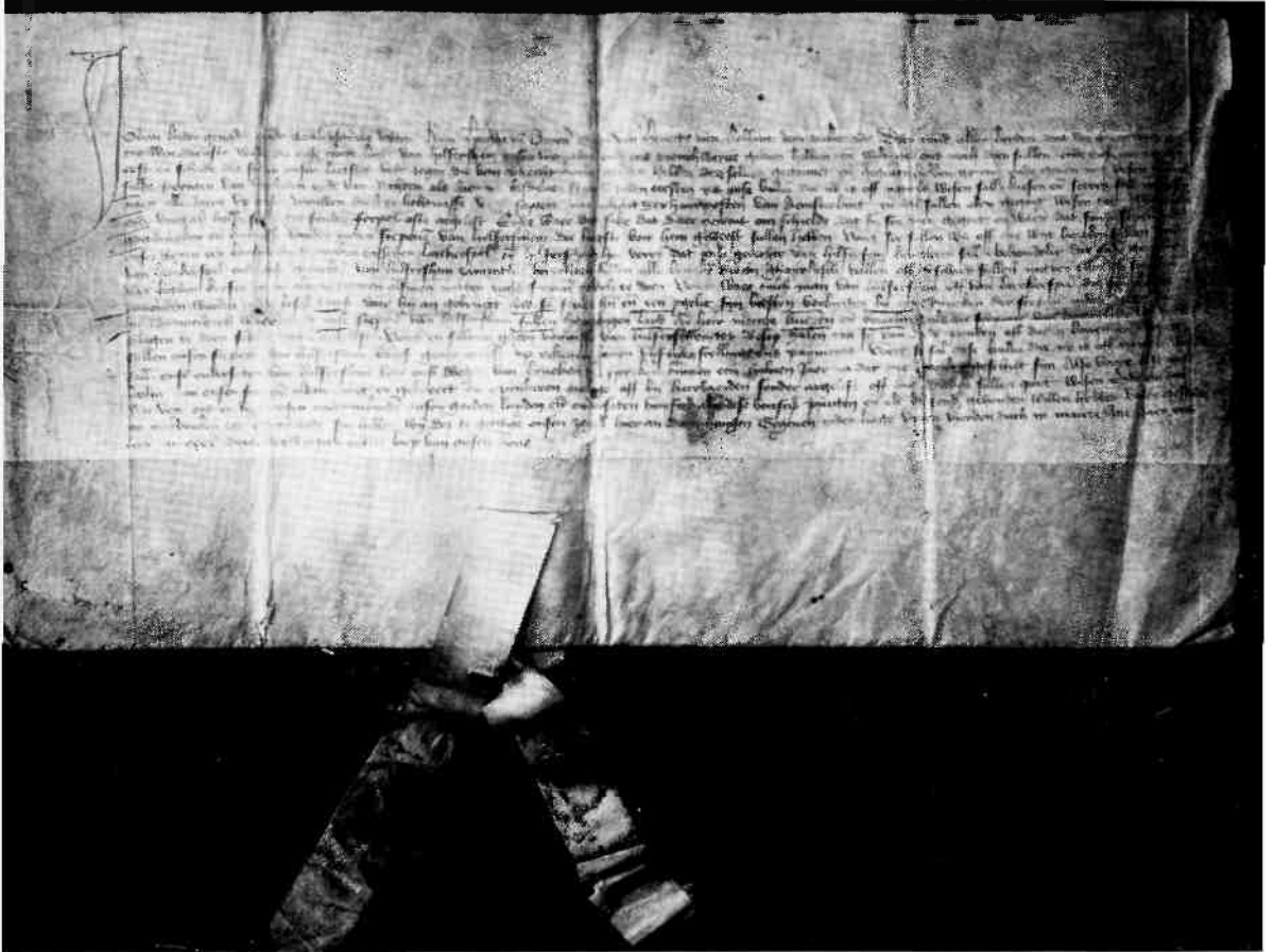
Het Privilege van Jan van Beieren aan Hilversum geschonken op 4 maart 1424. Hierin krijgt Hilversum een eigen gerecht waarmee het juridisch onafhankelijk van Laren wordt. De banscheiding tussen 'Larekerspel' en Hilversum wordt echter pas geregeld in een oorkonde in 1428 (origineel in Streekarchief, kopie bij Goois Museum).

echter voor wat ze zijn. Alleen de uitkomst is voor ons van belang. Op 1 Januari 1390 benoemde paus Bonifatius IX Jan tot elect van Luik. 6