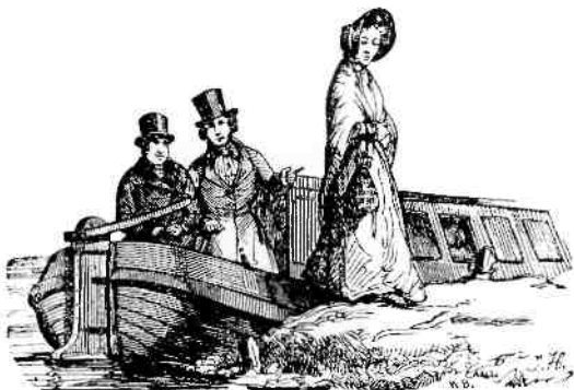
De benenwagen en de trekschuit waren tot 1850 de meest gangbare vorm van vervoer.

Veel dingen lagen vast in het leven op het platteland in 1850. Elke week markttag in de stad, en elke zondag naar de kerk. Elk jaar kalvertijd, hooitijd, grote schoonmaak en kermis op het dorp. Tegelijkertijd werd het leven veel meer gedictieerd door de wisselvalligheden van de dag. Het weer, de seizoenen en ziekten van mens, vee en gewas hadden een onvergelijkbaar grotere uitwerking.