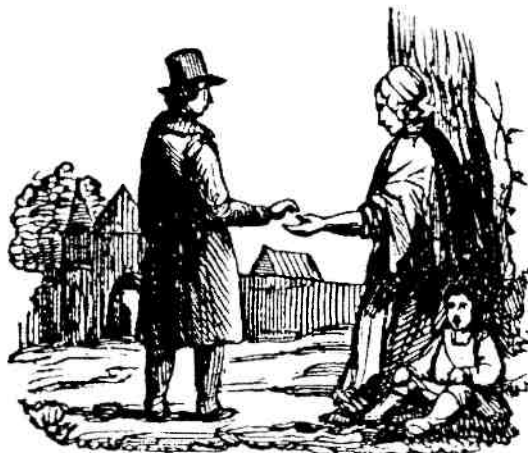
De jaren net voor 1850 waren bijzonder zwaar en brachten mensen tot de bedelstaf.

Het weer bepaalde in de akkerbouw het succes van de oogst, in de veeteelt wanneer de koeien van stal konden, of er genoeg voer was om ze door de winter te slepen of dat ze geslacht moesten worden.