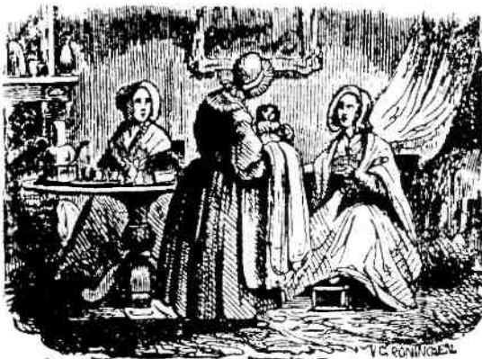
Bakerpraatjes: uit onwetendheid kregen zuigelingen door ongeschikt voedsel vaak ingewandstoornissen.

Vooraf in de poldergebieden was de kwaliteit van het drinkwater uitermate slecht. Het was in feite oppervlakte-water, ook als het uit een pomp kwam. En in de sloot verdween ook een groot