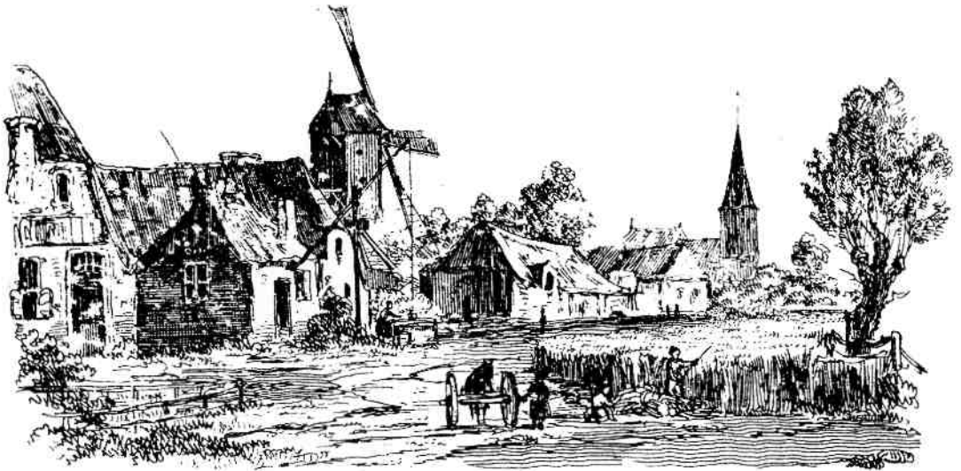
Een vrije impressie van Hilversum, zoals afgebeeld in het 'Penning-Magazijn voor de Jeugd', 1837. Het commentaar bij de afbeelding van 'het bloeiendste en welvarendste dorp van het geheele Gooiland' zou een illustratie kunnen zijn van de betrekkelijke welvaart die er in die tijd op het platteland heerste.

het eenvoudige plattelandsleven. Daarom werd het in die jaren mode om op grote schaal de bijl te zetten in het middeleeuwse erfgoed van de stad.