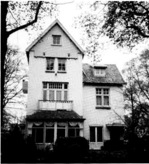
Voor 1910 werden slechts twee villa's in het gebied gebouwd, waaronder Curaçaoalaan 6 van 1904, oorspronkelijk "Maria" geheten. Villa's van die tijd zijn een symbool van welgesteldheid.

zijden twee parken aangelegd: het Alexanderpark in 1898 en het Heideveldpark in 1903. In 1913 werd aan de Zuidzijde van het dorp, langs de Utrechtseweg nog het park 't Hoogt van 't Kruis aangelegd.