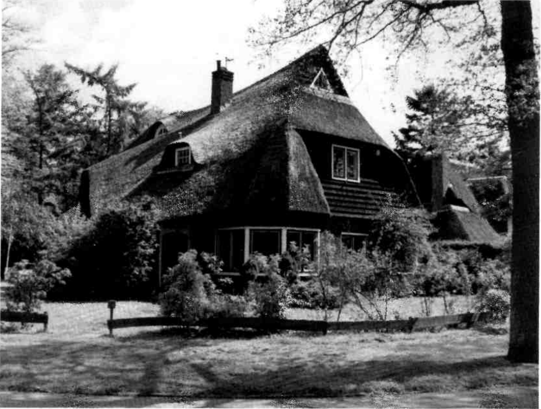
De villa Arubalaan 6 is een fraai voorbeeld van het Romantisch Expressionisme. Architect Th. Reuter, 1928. Opvallend zijn de gebogen dakvormen en de afdekking met riet en pannen. Ook werd in de geest van de Amsterdamse school veel gewerkt met hout en hadden alle ramen oorspronkelijk een roedeverdeling.

In het park is uit elke periode wel iets te vinden en daarom is een hele ontwikkeling van ideeën en wijze van inrichten te volgen.