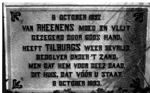
De gedenksteen aan het huis Hoge Naarderweg 84. Dankzij de huidige bewoners na 65 jaar omzwervingen door Hilversum weer terug op zijn oude plaats.