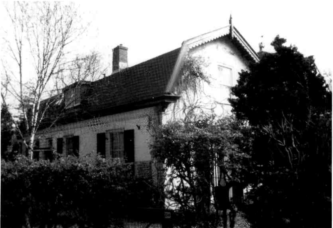
Het huis van Cornelis van Rheenen aan de Hoge Naarderweg 84 is nog steeds in goede staat (foto: voorjaar 1991, CvA).