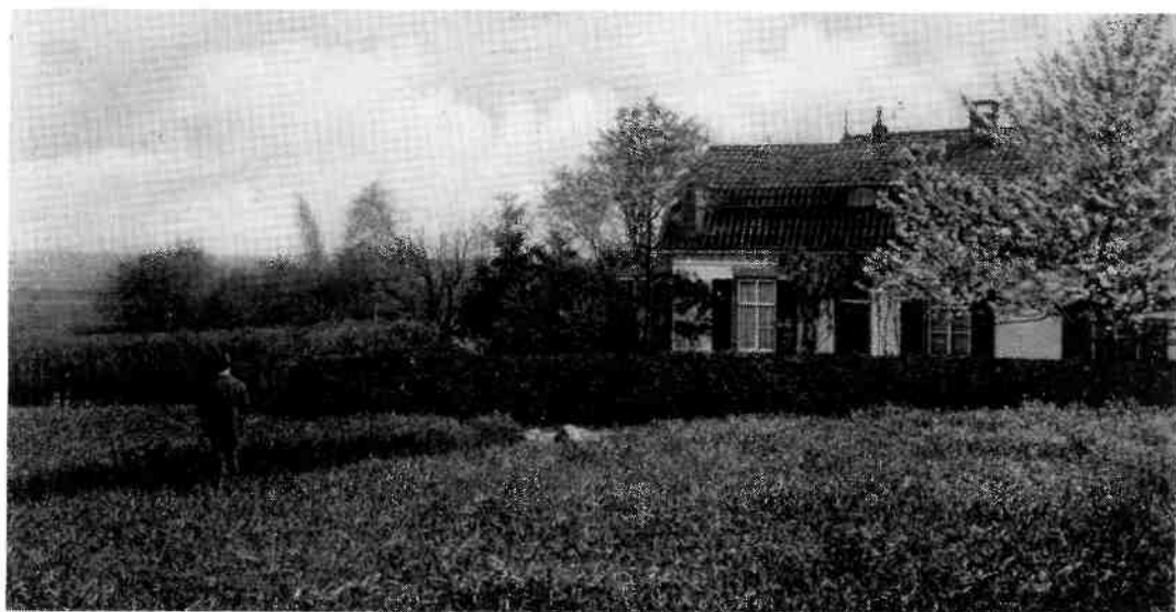
Hoge Naarderweg 84. Opname uit ±1910, de oudste bekende afbeelding van het huis.

voor het totale huis verbruikt is. De landelijke commissie vertrouwt erop dat zij aan het Nederlandsche volk slechts behoeven mede te delen dat nog f300,- ontbreekt, om weldra in staat gesteld te zijn het ontbrekende aan te vullen.