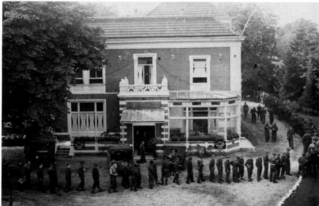
In de periode na de concerten verbleven duizenden Canadese soldaten voor een vakantie in Hilversum en omgeving. De Maple Leaf Club richtte daarvoor de huidige Bibliotheek in als restaurant. Hier staan soldaten in de rij voor hun soldij.

Daarmee was dus de reeks van zeven symfonieconcerten onder leiding van Hugo de Groot in Grand Theater Gooiland ten einde. De map erover in zijn archief bevat veel bewaarde stukken. Onder andere brieven van militairen die verzoek-