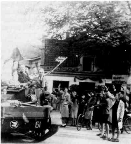
Binnenkomst van de Canadezen op 7 mei 1945, hier bij het Tolhuis aan de Soestdijkerstraatweg, hoek Utrechtseweg

De redactie heeft gemeend, dat het artikel nog aan waarde zou winnen als nog levende musici van het orkest van 1945 zouden kunnen worden geïnterviewd. In samenwerking met de auteur en met grote hulp van de heer G. den Boer van de Vereniging van Gepensioneerde Omroepmedewerkers zijn we er in geslaagd een aantal deelnemers op te sporen en over hun bevindingen te ondervragen. Zodoende zijn in de tekst 'geschreven illustraties' opgenomen.