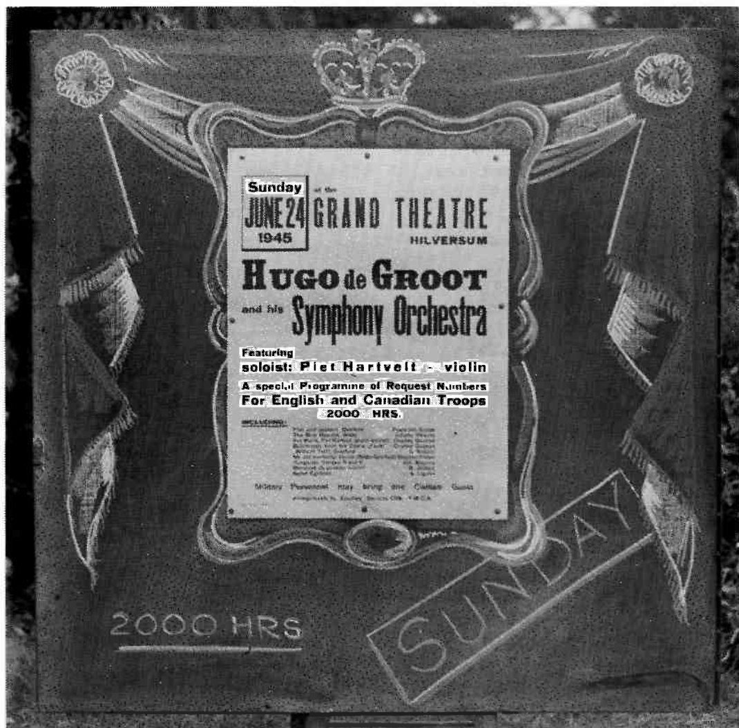
Een curieuse foto uit de collectie D. Murray Dryden (Toronto, Canada): een 'koninklijk' versierd bord met de – in het Engels gestelde – aankondiging van een van de concerten.

Het zevende en laatste concert werd op zater-