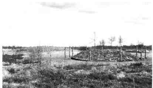
Bronstijdgrafheuvels: linksachter een heuvel uit het laat-neolithicum/vroege bronstijd zonder palenkrans, rechtsvoor een grafheuvel uit de midden bronstijd. Heuvel 105 en 106 aan de Erfgooiersstraat.

In de late bronstijd (1000 tot 700 voor Christus) vond de crematie van de doden algemene ingang. Daarbij zag men eindelijk af van de traditie van de grafheuvels: de crematieresten werden in urnen bijgezet in urnenvelden. Daarbij werd de palenkrans (als grens tussen de wereld der levenden en die van de doden?) vervangen door een greppeltje rond de begraven urn. Zodoende spreekt men ook wel van 'kringgreppelgraven'. Over de bewoners van het Gooi in de late bronstijd is verder vrij weinig bekend.