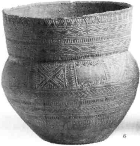
Een klokbeke, ca. 2200 voor Christus. Eén van de fraaist versierde aardewerkvormen uit de prehistorie.

werden ook stenen strijdhamers gevonden. De klokbekers waren fraai versierd en worden tot het mooiste aardewerk uit de prehistorie gerekend. Evenals het trechterbekervolk woonden ook de starvoetbekermensen en klokbeke-makers in grote delen van noord-west Europa.