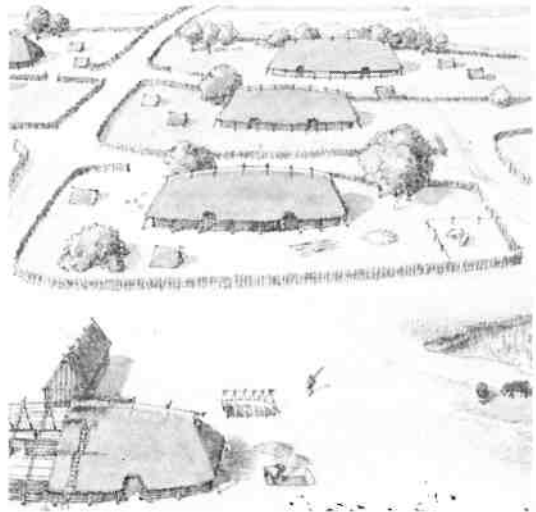
Reconstructie van het type boerderij uit de vroege middeleeuwen. Detail uit een tekening van Bob Brobbel.

Mededelingen van het museum voor het Gooi en Omstreken, nr. IX, 1967/1968, p. 84-86.