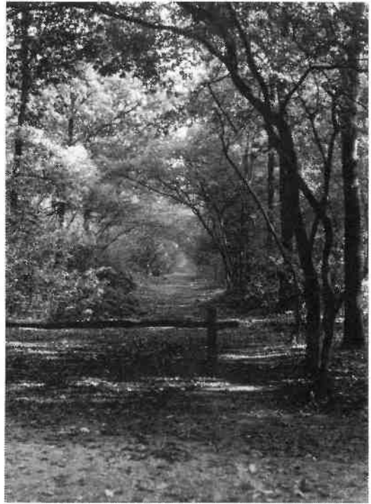
Trompenburgerlaan, gezien van Corverslaan, richting Quatre Bras.