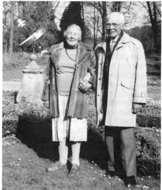
Het echtpaar Houthoff, bewoners van de Trompenburg vanaf 1953, gefotografeerd in het voorjaar 1992.