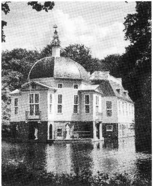
De Trompenburg, vanaf het Zuidereind te 's-Graveland.