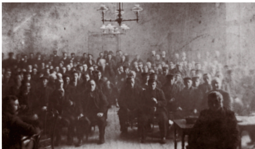
Eén van de weinige historische foto's van het interieur van Hof van Holland. Hier vergadert de "Nieuwe Partij" van ontevreden Erfgooiërs in 1912.