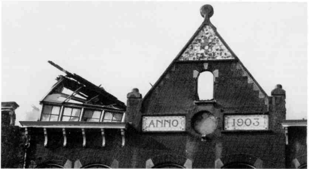
Boven: foto van de zijde van de school aan de Jonkerweg tijdens de brand kort voor de zomervakantie in 1990. De topgevel werd wegens instortingsgevaar kort na deze foto door de brandweer omgetrokken.