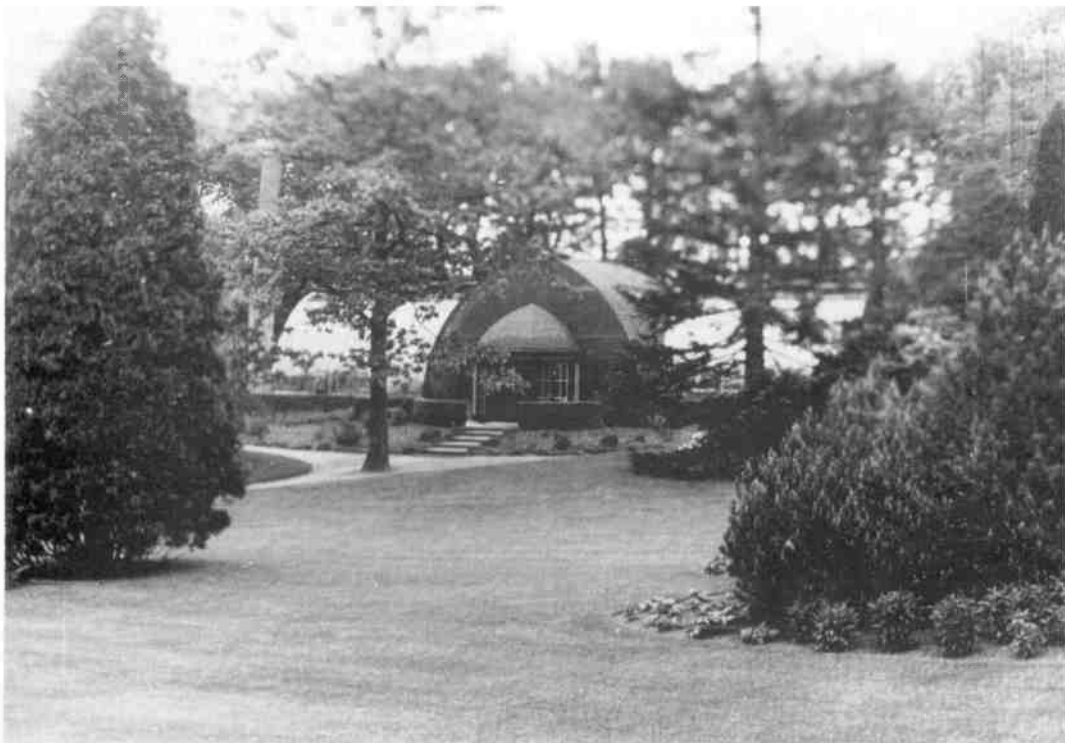
In de tuin van de villa "Roemah Oedjong"; vermoedelijk aan de zijde van de Peerlkamplaan, stond een kas die blijkens de schoorsteen verwarmd werd. Situatie 1931.

12 februari 1936 kocht de NCRV de leegstaande villa met 145 are grond. Het kapitale pand kreeg een nieuwe bestemming.