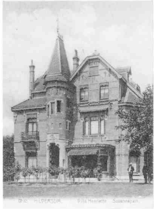
De villa Henriëtte voor 1916, gelegen in het Suzannapark, later Schuttersweg 8 en kantoorvilla van de NCRV.

Dit is een citaat uit de levenbeschrijving van de welgestelde Amsterdamse assuradeur Jan ter Meulen. Zijn moestuin en kippenren hebben al-