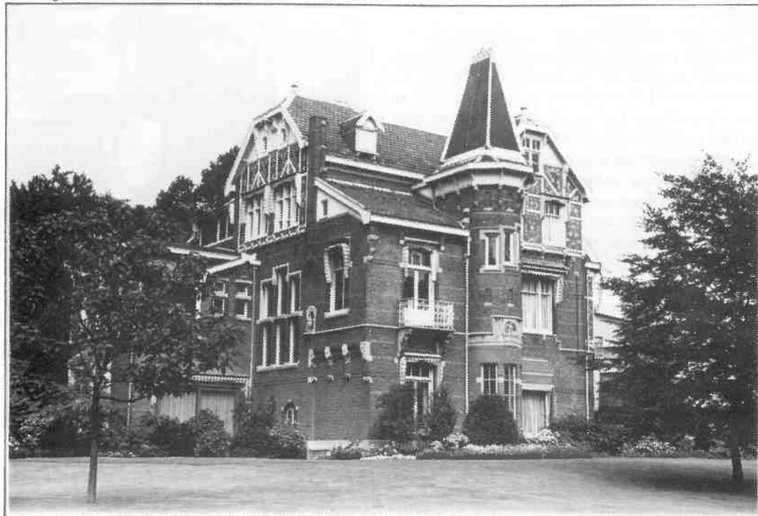
In de NCRV-periode onderging de villa tal van wijzigingen. De entree aan de zuidgevel (zie foto vorig artikel) werd in 1939 gewijzigd in een drietal smalle ramen. Ook de serre rechts van de vroegere entree verdween. In 1973 werden de ramen van de voormalige biljartkamer vervangen door een schuifpui (linksonder). Ook de schoorstenen ondergingen wijzigingen.

De indiening van bouwtekeningen voor omroepgebouwen geschiedde in deze periode overigens niet door de zendgemachtigde. Op 9 oktober 1973 diende de NOS een officiële aanvraag in bij B & W Hilversum om de bestaande deur met twee ramen (voormalige biljartkamer Jan ter Meulen) op de begane grond te wijzigen in een schuifpui, hetgeen geschiedde.