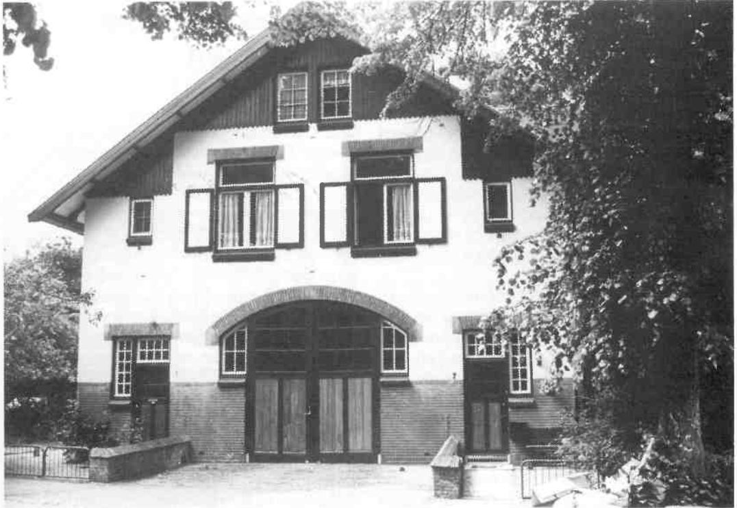
Het koetshuis dat Jan ter Meulen liet bouwen in 1906, nu gelegen aan de van Yssumlaan 5-7. Een ontwerp van E. Verschuyf, die meer bouwde in de NW-villawijk maar ook het volkswoningbouwcomplex Egelantierstraat e.o.

De hoofdingang van het huis zat toen wij er woonden aan de Bergweg, waar het toen trouwens nog Suzannapark heette. Naast de ingang zat een klein kamertje en daarboven was mijn slaapkamer.