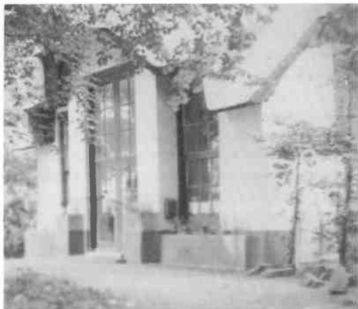
In de tuin van de villa stond een Orangerie, die tussen 1947 en 1957 bewoond werd door het echtpaar Koen.