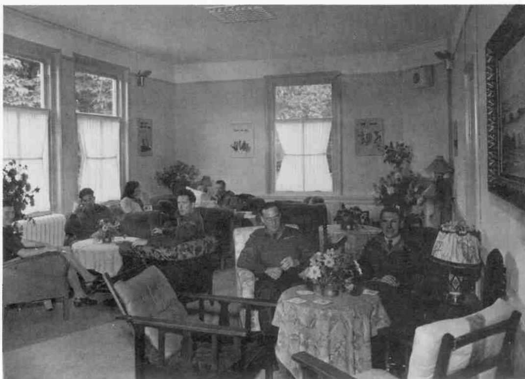
De bovenverdieping van de Maple Leaf Club: een rustige plaats voor de minder danslustigen.

"Please get rid of the smelly orange juice and give us our coke." [Weg met dat muf ruikende sinaasappelsap. Geef ons onze cola.]