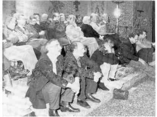
De opkomst op 8 februari 1994 was goed.

GL : Heel veel geld naar raadhuis ivm. fouten in construc-