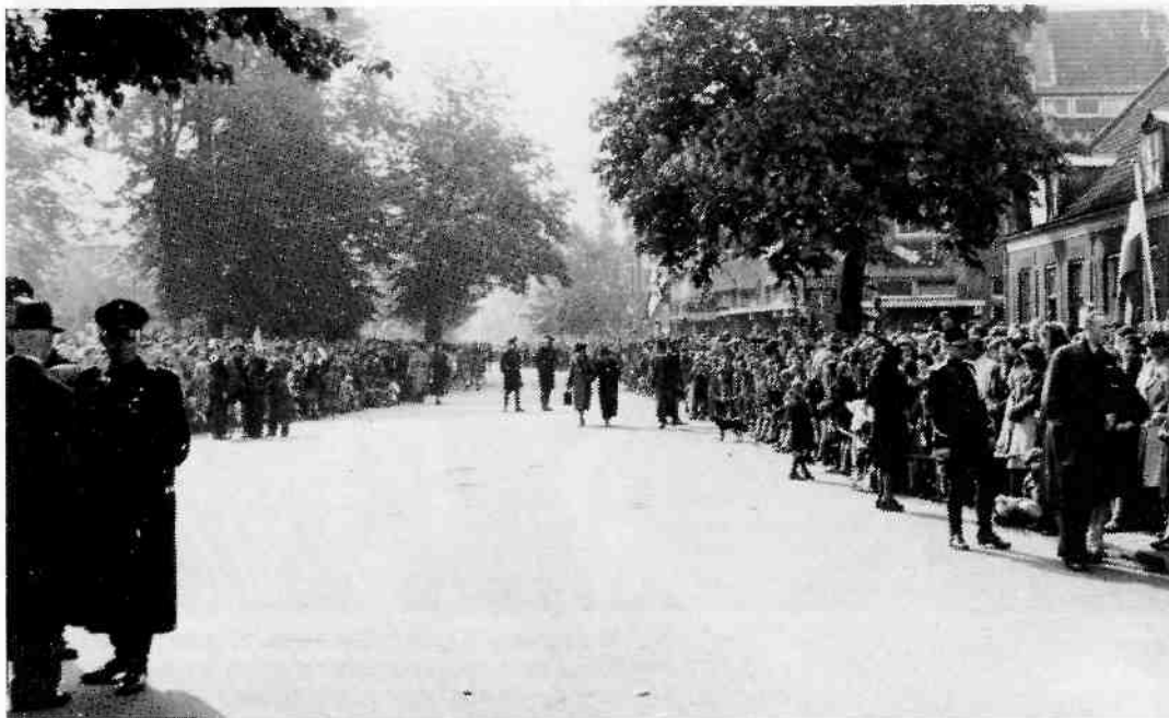
7 mei 1945 in de Emmastraat. Duizenden mensen in afwachting van de dingen die komen.

Om twee uur 's middags was ik weer terug in Loosdrecht. Ik kwam met de twee eerder genoemde Duitse officieren overeen dat, als alle gewapende gevangenen, die zich in onze handen bevonden, voor vier uur zouden worden vrijgelaten, er geen represailles zouden volgen en de levens en bezittingen van bewoners van Loosdrecht gespaard zouden blijven. Vergezeld van dokter Van Wieringen uit Loosdrecht trokken