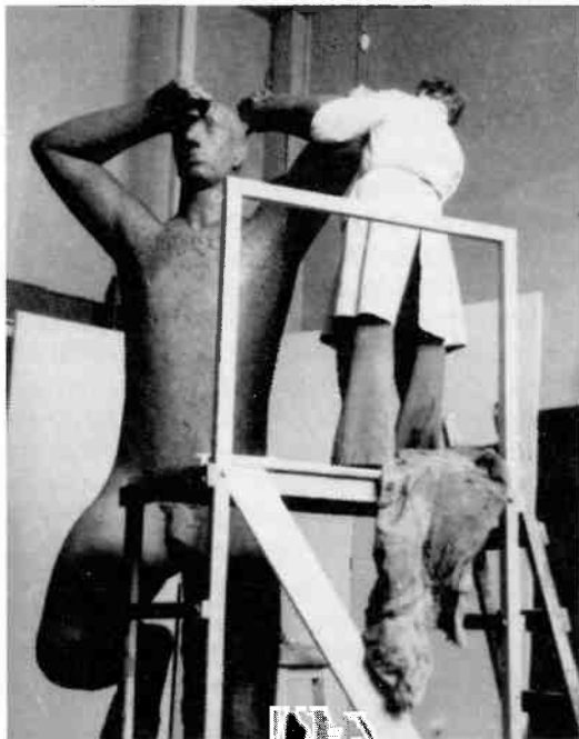
Een foto uit de privé-verzameling van prof. Esser, gemaakt in zijn atelier in de Rijksacademie te Amsterdam. Het klei-model nadert hier zijn voltooiing.