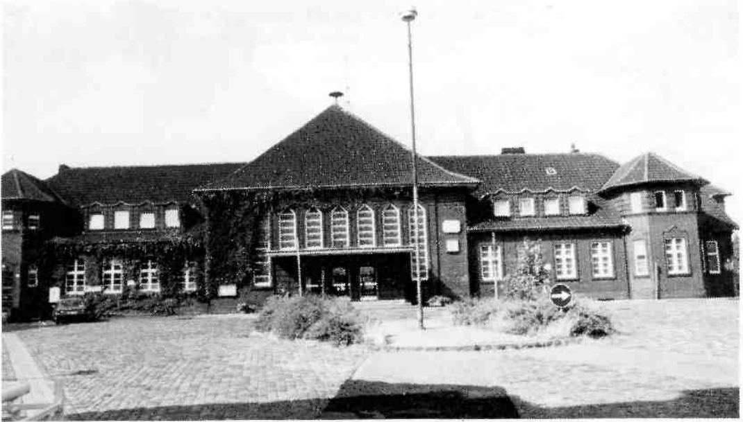
Het station van Bramsche anno 1994. Hier kwamen de Hilversumse mannen op 1 november 1944 aan. Elke ochtend werden ze van hier vervoerd naar het werk. Ze hadden er dan al een wandeling van ruim een half uur opzitten.

door het zware werk, de slechte omstandigheden, mishandelingen en het slechte voedsel zijn een groot aantal Hilversummers in Bramsche en omgeving omgekomen. Dat bracht me ertoe de overlijdensadvertenties eens na te kijken. Normaal lees ik die niet vaak, maar nergens is bekend hoeveel Hilversummers er nu in Bramsche zijn omgekomen en misschien bieden de overlijdensadvertenties een aanknopingspunt. En inderdaad verschenen er vanaf december '44 veel advertenties met een afwijkende tekst: "Heden bereikte ons het ontstellende bericht dat is overleden..." etc., waarbij ook meestal stond dat de begrafenis inmiddels had plaatsgevonden. In de meeste gevallen zullen dit mannen hebben betroffen die in Duitsland overleden zijn. Daarbij moeten we echter wel bedenken dat er al voor oktober '44 Hilversummers in de 'Arbeitseinsatz' naar Duitsland gevoerd zijn, zodat niet alle advertenties betrekking hoeven hebben op Bramsche en omgeving (er werd toen in heel Duitsland dagelijks zwaar gebombardeerd). Maar nadat ik een lijstje had gemaakt van namen, data en adressen viel er iets anders op: Het merendeel van de overledenen bleek te hebben gewoond in slechts drie of vier straten in de wijk Over 't Spoor. En dat kan haast geen toeval zijn.