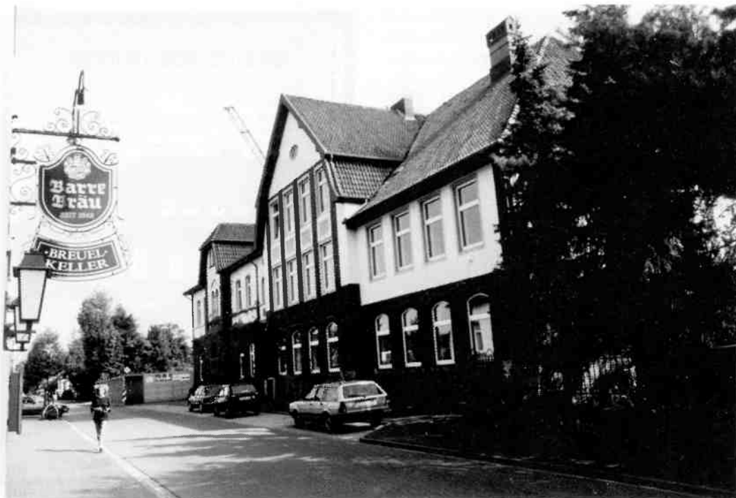
De 'Volksschule' in Bramsche anno 1994. Het gebouw dateert van 1911. Hier werden ca. 200 Hilversummers ondergebracht, waaronder veel omroepmedewerkers.

te groep omroepmensen in Duitsland terecht kwamen. Zo waren er negen leden van "The Ramblers" die mee moesten, maar er al in Amersfoort vandoor gingen. Daar moesten ze in de buurt van Achterveld putjes graven, waarbij de bewaking aanvankelijk niet zo streng was. De mannen mochten zelfs 's avonds de stad in. Evenals de Ramblers zijn er een groot aantal Hilversummers tussenuit gegaan (vaak met hulp van Amersfoorters) en hebben de rest van de laatste oorlogswinter min of meer ondergedoken gezeten, want hun persoonsbewijs moesten ze natuurlijk in Amersfoort achterlaten.