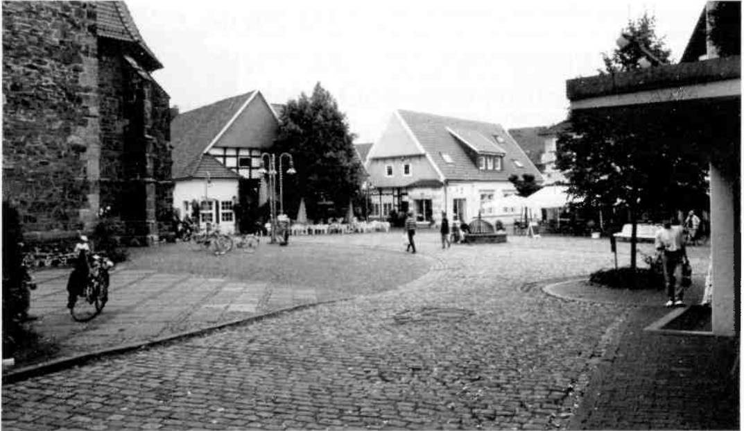
De Kirchplatz in Bramsche anno 1994. Bramsche is met zijn tijd meegegaan en dit plein vormt nu het centrum van het winkel/voetgangersgebied. Het is een kruising van voormalige middeleeuwse handelswegen.

steld aan de IJssel bij Zwolle) geen barst klopte. Ik volg echter het traject van toen, in de moderne, comfortabel rijtuig dat door de Deutsche Bundesbahn op dit internationale traject zo welwillend ter beschikking is gesteld. In Apeldoorn gingen zij naar Zutphen, pas in Hengelo zal ik weer het oorspronkelijke traject gaan volgen. Kort voor Deventer passeren we de IJsselbrug. Op het talud staat, bij wijze van monument, nog een stukje van een oude brug. Zou dat nog van de brug zijn die in '44 weggebombardeerd was? Rond 5 over 9 passeer ik Oldenzaal, zonder te stoppen. In '44 werd hier wel gestopt, waardoor een aantal mannen de kans waarnamen om de trein uit te vluchten. Daar zijn helaas wel doden bij gevallen.