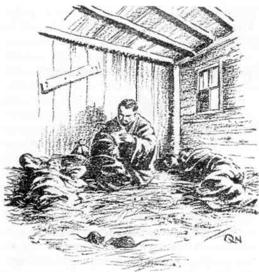
De leefomstandigheden in de barakken aan de Lutterdamm waren zeer slecht. Een tekening van Pieter Kuun uit: Arbeider in moffenland.

ontvangen. Overigens was in het algemeen de situatie in Hilversum, zoals het bombardement op Trompenberg, de erge honger en het tekort aan brandstoffen wel bekend in Bramsche.