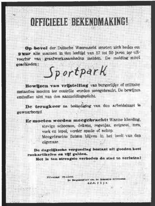
De officiële bekendmaking van 23 oktober 1944, waar het allemaal mee begon. Een vraag blijft het echter waarom de razzia in de vroege ochtend werd gehouden, terwijl de mannen zich pas om 9 uur moesten melden.

treten. Overigens vonden dergelijke razzia's ook in andere plaatsen plaats (o.a. Rotterdam) waarbij de achterliggende gedachte bij de Duitsers was dat het, gezien het oprukken van het geallieerde front, tijd werd alle weerbare mannen naar Duitsland weg te voeren, zodat zij zich niet bij de geallieerden aan konden sluiten. De SD ving trouwens meer dan alleen maar Hilversumse mannen. Om half tien die ochtend werden er twee Engelse onderdanen bij het politiebureau gebracht om daar tot nader order opgesloten te worden. Het betrof A. Hornick en S. Woods. Om kwart voor twee kwam er weer een groepje arrestanten binnen, waaronder de Engelsen G. J. Caughlin en J. Caughlin. Zij allen zouden de 26ste door de Feldgendarmarie naar Amsterdam overgebracht worden. Van hun lot is verder niets bekend, maar je vreest onder die omstandigheden het ergste.