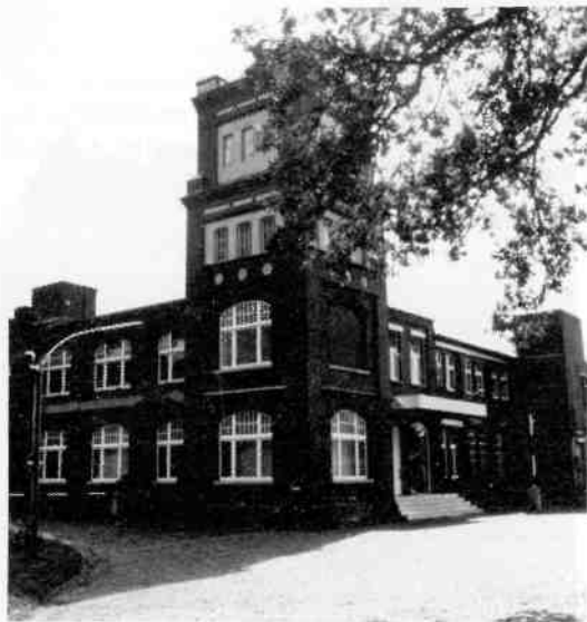
De behangselfabriek aan het begin van de Lutterdamm. De Hilversummers kwamen hier twee keer per dag voorbijlopen, op weg naar het station, waarvandaan ze per trein naar het werk vervoerd werden.

Teruglopend naar de stad breng ik nog een bezoek aan het kerkhof. Hier blijken zich geen graven van overleden Hilversummers meer te bevinden. Later lees ik in mijn nieuw aangeschafte boek, Bramsche, eine Stadtgeschichte , dat hun stoffelijke resten van hen kort na de oor-