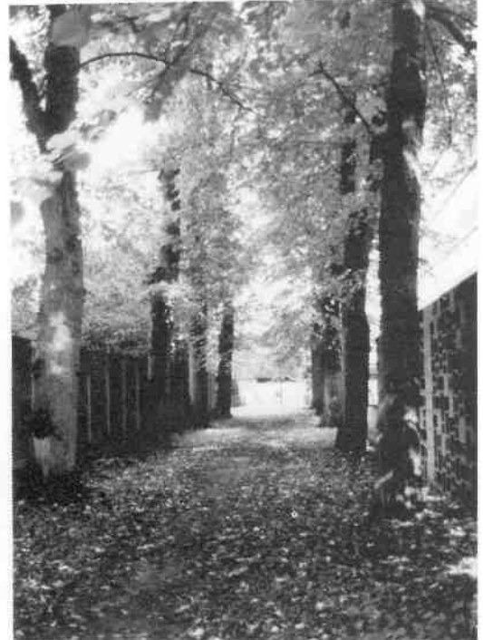
Tussen de Vaartweg en de Bergweg heeft het naamloze pad het karakter van een laan.