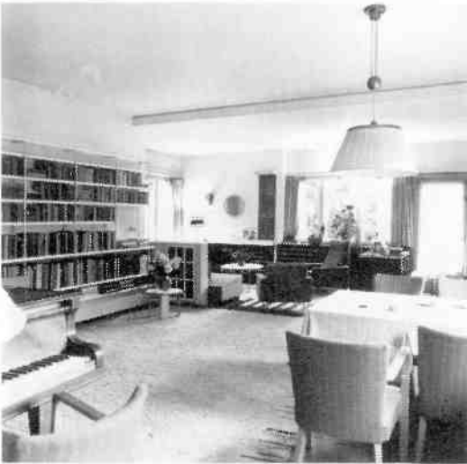
Interieur van de huiskamer in 'de Wikke', het woonhuis aan de Utrechtseweg 71, dat door Dudok voor zichzelf en zijn gezin werd ontworpen.

Een rijbewijs was al na een paar lessen te behalen. Als je maar voor- en achteruit kon was het geloof ik al genoeg. Een dag nadat vader de papieren had, reden mijn moeder en ik zonder enige angst langs de spekgladde wegen naar Amsterdam waar vader zijn auto neerzette op het Leidseplein en we afspraken dat hij ons om vier