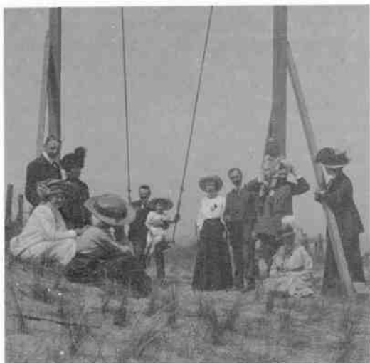
De foto hierboven is uit 1910. Wim Dudok (geheel links) en Marietje Smit (in het wit voor hem) met vrienden in hun verovingstijd in de duinen.

Toen de verplichte dienstjaren als genie-officier waren volbracht, ging vader als adjunct-directeur van gemeentewerken naar Leiden. Hij kreeg daar ook een particuliere opdracht, een kantoor voor het Leids Dagblad. Toen hij eens met voldoening naar de bouw stond te kijken, zei een voorbijganger tegen hem: Meneer, da's nog een stuk antiek. Hoezo? , vroeg vader verbaasd. Nou da's een heel oud gebouw in Zweden, dat ze hier namaken. Vader begon te lachen, en zei: Grappig dat U dat nu net aan mij vertelt, want ik ben de architect en ik heb het heus zelf verzon-