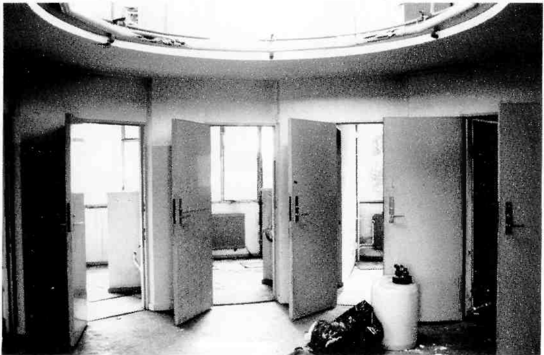
De kamertjes in het Dienstbodenhuis waren erg functioneel. Als men binnenkwam bevond zich aan de rechterhand een wastafel en aan de linkerhand een ingebouwde kast. Verder het kamertje inlopend opent de ruimte zich naar buiten toe, door de taartpuntvormige plattegrond. Achter het halfhoge muurtje is er precies plaats voor een bed en daarnaast voor een tafeltje en een stoel. Zie ook de plattegrond bij dit artikel (foto: Peter van Woerden).