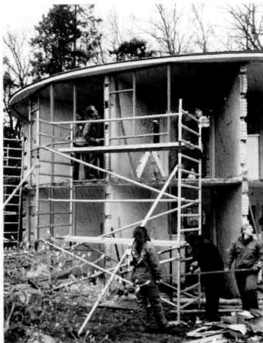
Na de reparatiewerkzaamheden en het schoppen, d.w.z. het voorzien van een beschermende zinklaag, in de fabriek, keerden de pui begin april terug op de bouwplaats. Hier worden de eerste pui weer gemonteerd.

Naast de grootste financiële bijdrage van de Rijksdienst voor de Monumentenzorg, dekt de arbeid van de studenten een groot deel van de begroting. Verder is de financiële en materiële steun van bedrijven en instanties onmisbaar geweest voor de realisatie van dit project.