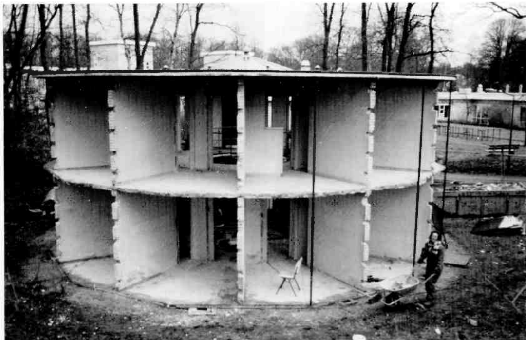
In februari j.l. zijn de eerste werkzaamheden gestart. De stalen puien zijn gedemonteerd en hierna in de fabriek gerepareerd. In de periode tussen de demontage en de montage eind maart stond het gebouw er als een skelet bij.

Dienstbodehuis als expositieruimte is een mindere behaaglijkheid acceptabel.