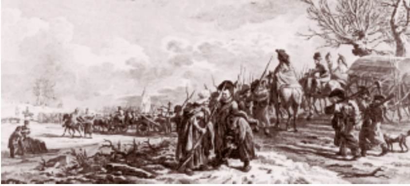
De Fransen trekken over de rivier de Waal bij Zaltbommel in het jaar 1794. Een gravure van C. Brouwer naar een tekening van J.A. Langendijk. (Atlas van Stolk, Rotterdam, FM 5285)

het Koninkrijk Holland (1806-1810), een creatie van Napoleon, en later zelfs ingelijfd in het Keizerrijk (1810-1813). Zeker, de Fransen verklaarden in hun proclamatie van 20 januari 1795: Wij komen niet bij u om u onder het juk te brengen.