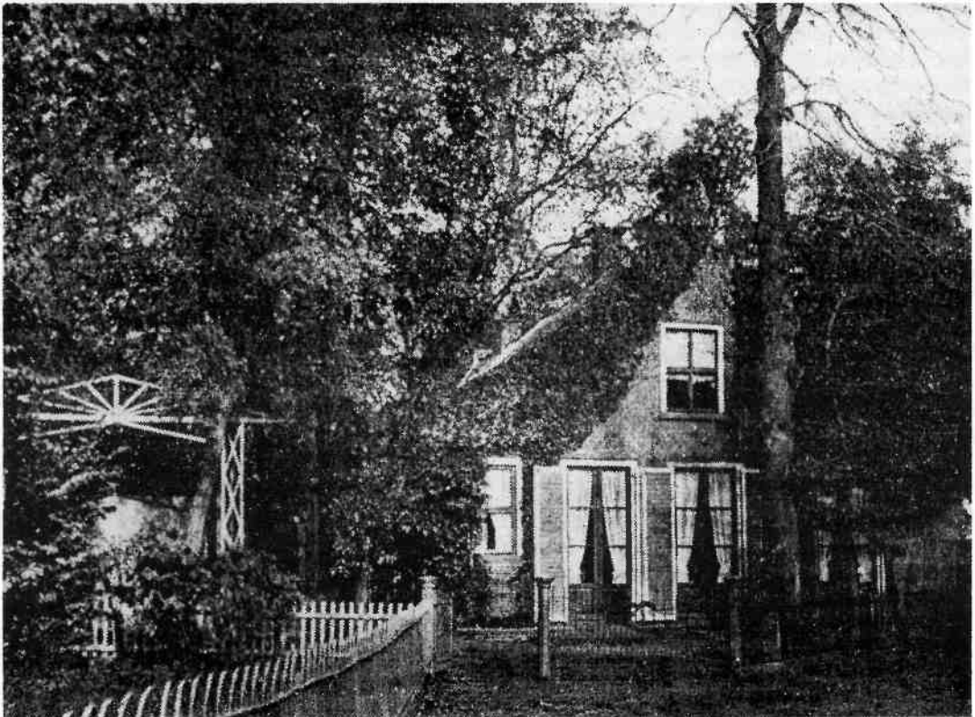
Het ouderlijk huis van James de Rijk, 'Lang Gewenscht'.

Een aanzet tot beschrijving van Hilversumse kunstschilders van de Romantische stijl heb ik eerder gegeven in een beknopt artikel 'Kunst-