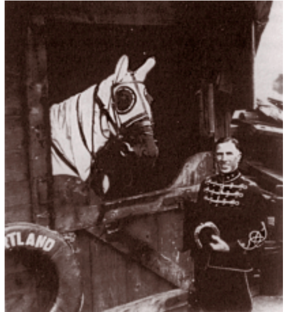
Charles Pahud de Mortanges (1896-1971) met zijn paard Marcroix, waarmee hij in 1924, 1928 en 1932 gouden medailles won.

Eén van de belangrijkste voorwaarden voor succes van