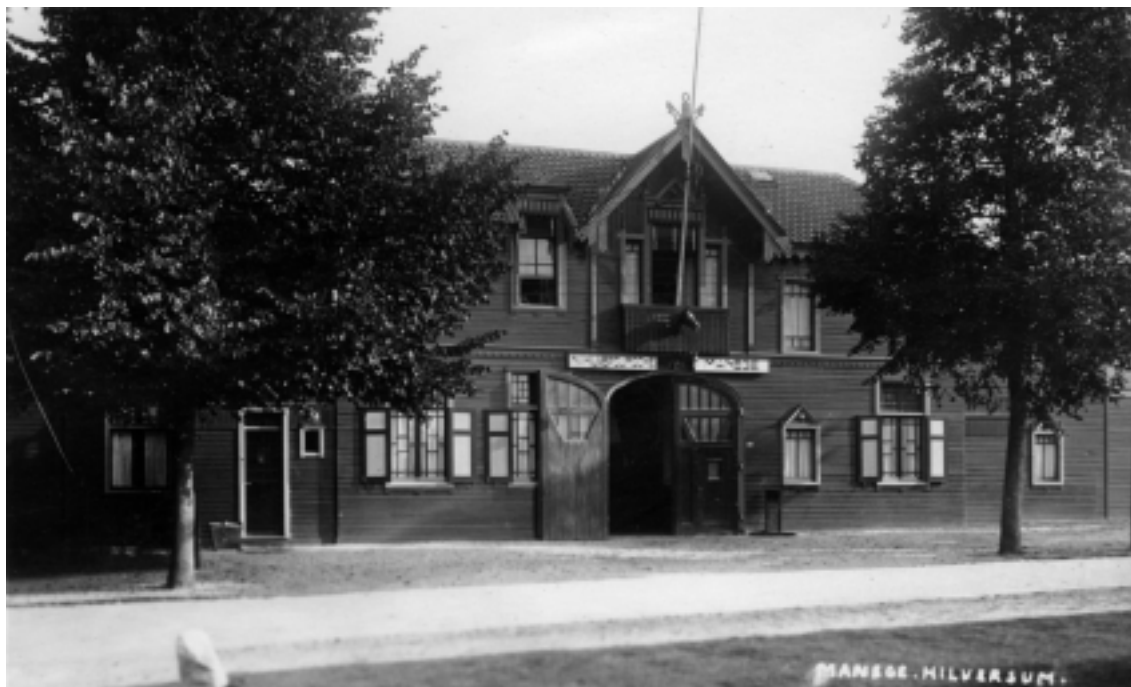
De manege aan het eind van de Jonkerweg, tegenover de HBS, bood onderdak aan vele olympische paarden.

derhandelingen i.v.m. de Spelen toch wel graag wilde voortzetten. Helaas keerde hij door zijn ziekte niet meer terug als directeur en werd uiteindelijk opgevolgd door de heer Dekker.