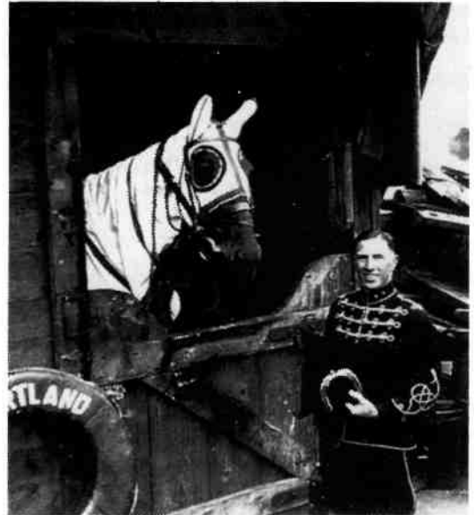
Charles Pahud de Mortanges (1896-1971) met zijn paard Marcroix, waarmee hij in 1924, 1928 en 1932 gouden medailles won.

Evenals nu het geval is was de aanloop naar de Spelen van '28 lang. Reeds in 1923 moest het Nederlandsch Olympisch Comité (NOC) harde toezeggingen doen om de Spelen naar ons land te krijgen. Die toezeggingen hadden vooral betrekking op de financiering van het evenement en dat was niet eenvoudig geweest. Een voorstel voor een bijdrage in de kosten was in de Tweede Kamer verworpen. Amsterdam moest het zelf maar opknappen. Daar zag men het belang van de Spelen voor Amsterdam wel in. Het gemeentebestuur stelde a fonds perdu een half miljoen gulden beschikbaar en schreef ten laste van Amsterdam een premielening van vijf miljoen uit, wat toentertijd vrij grote bedragen waren. De lening was snel voltekend en in feite waren het dus