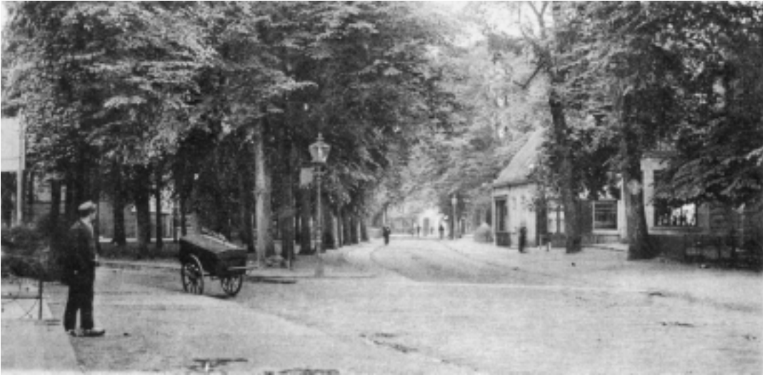
De brink van Hafkenscheid rond 1900, voordat de Kei geplaatst werd. Rechts is het toen nog bestaande hoekhuis met nr. 119 (zie de schetskaart) te zien.

aan de zijde van de Kerkbrink liet hij de familiewapens van hem en zijn vrouw aanbrengen. Deze begraafplaats werd in 1793 buiten gebruik gesteld toen de begraafplaats “Gedenkt te Sterven” aan de overzijde van de Oude Torenstraat geopend werd. Het oude kerkhof rond de kerk is nooit geruimd. Bij graafwerkzaamheden rond de kerk stuit men nog regelmatig op skeletresten van oude Hilversummers.