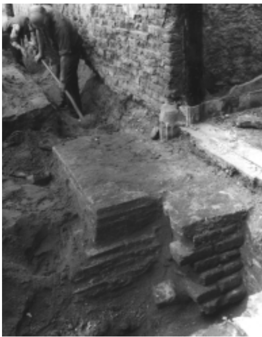
Opgravingen bij de Grote Kerk in 1973. Bij de oude ingang onder de toren aan de Oude Torenstraat zijn de funderingsresten van kloostermoppen zichtbaar die onderdeel waren van de kerk die in of kort na 1416 daar gebouwd is.

tijdens de dorpsbrand afbrandde, was zijn weduwe eigenaresse.