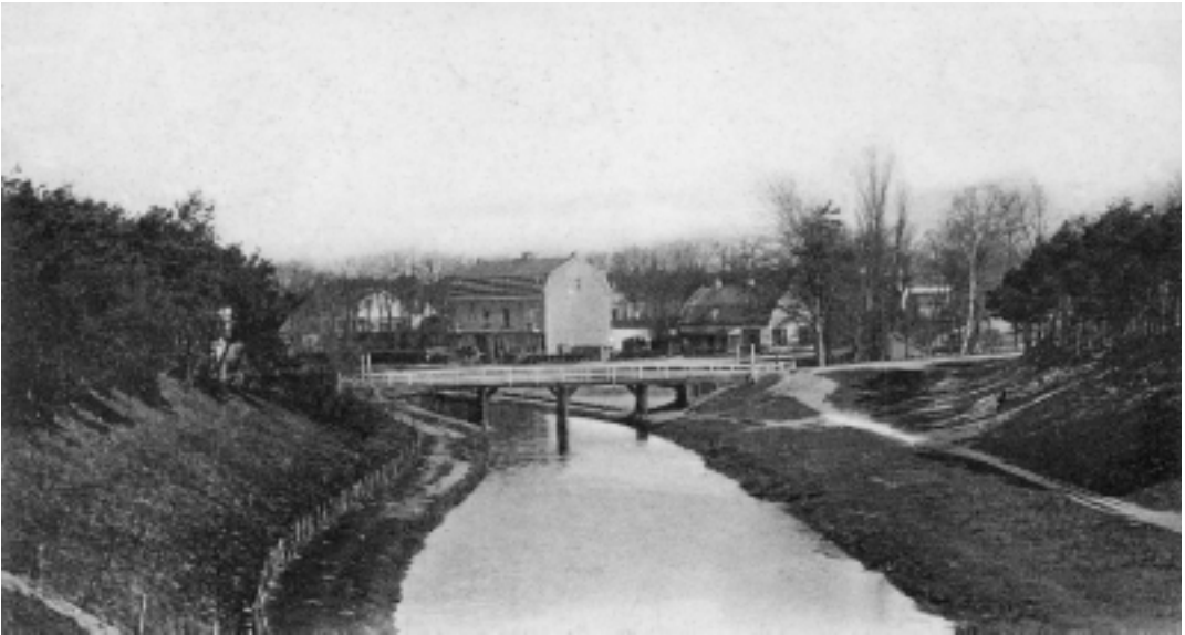
3. Gezicht op de Hondenbrug rond 1902 met daarachter de Oude Loswal. Goed te zien is dat er door de uitgraving van het Loosdrechtse Hoogt veel ruimte onder de brug is. (coll. auteur).

18e eeuw de stenen boog werd vervangen door een houten brugdek bleef de oude naam gehandhaafd.