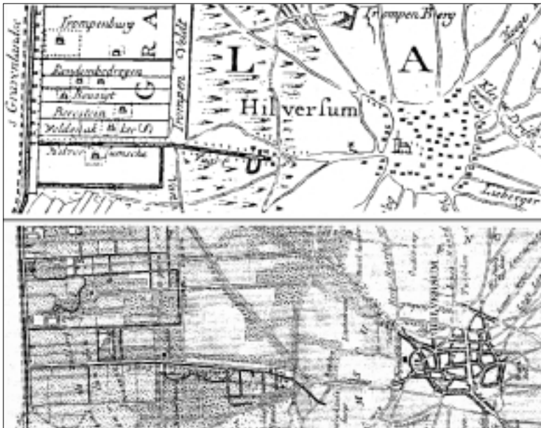
1. De Vaart in 1750 en in 1843. De zanderijsloten aan de zuidkant van de Vaart zijn goed te zien en op de onderste kaart ook de afbuiging naar het Loosdrechtse Hoogt. Op de bovenste kaart staan zelfs heel klein de bomen afgebeeld.

Al aan het einde van de middeleeuwen was het graafschap Holland één van de meest verstedelijkte gebieden in de Nederlanden. Rond 1600 woonde bijna de helft van de Hollandse bevolking in steden. Holland was door zijn scheepvaart en handel en de daarmee samenhangende nijverheid een aantrekkelijk gebied voor vestiging geworden. De meeste van deze stedelingen waren ambachtslieden, zeevarenden of kooplieden en bezaten doorgaans geen land dat ze zelf bewerkten. Zij waren voor hun voedsel afhankelijk geworden van wat zij konden kopen. En hier begon in Holland de schoen steeds meer te wringen. De landbouwgronden rond de steden waren veengebieden. Door turfwinning en inklinking van de grond werd het, ondanks de vernuftige afwate-