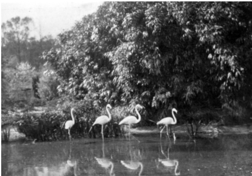
Flamingo's op Gooilust, 1909. Coll, A. Coops.

De N.V. Kina Cultuurmaatschappij te Amsterdam had in 1928 het oog laten vallen op het terrein ten zuiden van de Gooische Vaart in de gemeente 's-Graveland, waar zich nu de gebouwen van de sportvereniging Altius bevinden. Hier wilde