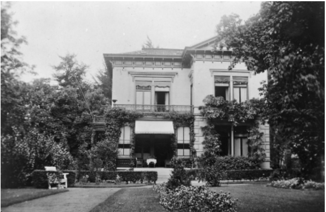
De villa Speranza aan de 's-Gravelandseweg, waar de ouders van Roland Holst van 1904 tot 1923 woonden. De vader van Roland Holst liet deze villa in 1904 bouwen.