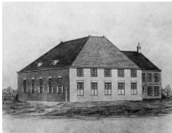
De schuurkerk uit 1786 van de rooms-katholieken aan het Veeneind, de huidige Emmastraat, op de plaats waar nu de St. Vituskerk staat.

De omwenteling beëindigde de ongelijkheid en vanaf toen betaalde ieder voor de eigen groep. En zo ontvingen de Potarmmeesters voortaan slechts eenderde van de publieke armengelden, naar rato van het aantal gereformeerden.