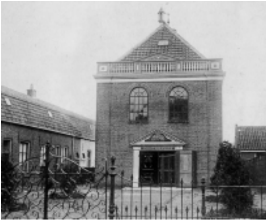
De synagoge aan de Zeedijk op een foto uit 1896. Het gebouw dateerde uit 1788.

zijn dood kwam bezoeken en terugbrengen tot de verlaten moeder[kerk]. De wrijving tussen de verschillende gezindten bleef niet beperkt tot kerkgang en kerkbouw; ook de bemoeienis met het onderwijs, de armenzorg en het publiek vermaak zorgde voor onenigheid.