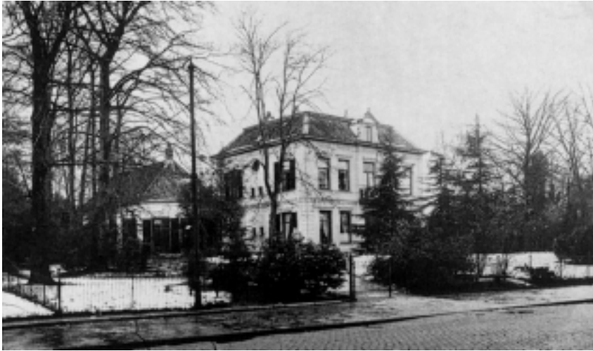
Villa van de familie Groskamp aan de 's-Gravelandseweg. In de tuin van deze villa traptten de Victorianen hun eerste bal. (uit: Victoria 100 1893-1993)

Groene Laan in het Corversbos, omdat de oude locatie wel erg krap was geworden. In 1900 was het echter gedaan met de eerste Hilversumse voetbalvereniging; in dat jaar hief de vereniging zichzelf op.