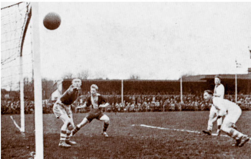
Een spelmoment uit één der promotieduels die 't Gooi en de FC Hilversum tegen elkaar speelden. (uit: Veertig jaren lief en leed)

Zonder acht te slaan op levensbeschouwelijke richting werd over en weer hulp geboden aan verenigingen die in nood zaten. Toen in 1965 de accommodatie van Olympia in rook opging, kreeg de club hulp van Actif, maar ook van 't Gooi. De Venetaclub Gooise Boys kreeg onderdak bij Bloemenkwartier toen het eigen terrein onbespeelbaar was geworden en het protestantse Altius huurde van het