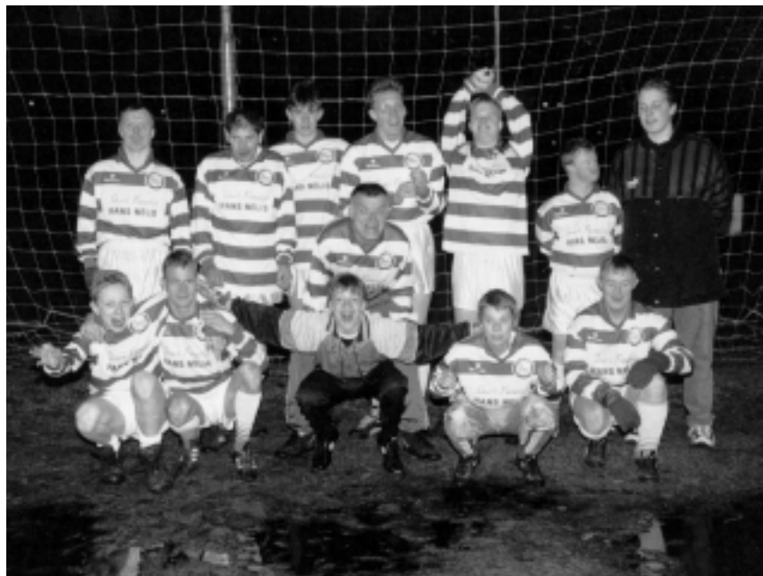
Zebra's kent een G-afdeling. Bij deze club kunnen gehandicapten in competitieverband voetballen.

De laatste vereniging die in dit artikel aandacht krijgt, is de Zebra's (1928). Ook dit was een buurtclub en wel uit het gebied rond de Hoge Larenseweg. Alhoewel veel jongens van katholieke huize waren, werd het geen katholieke vereniging. De kern van de club bestond uit jongens wier ouders kleine zelfstandigen waren. De jongens die de club oprichtten hadden de steun van hun ouders, die ook de vereniging gingen leiden. Het eerste veld was het Groene Veldje, gelegen in de