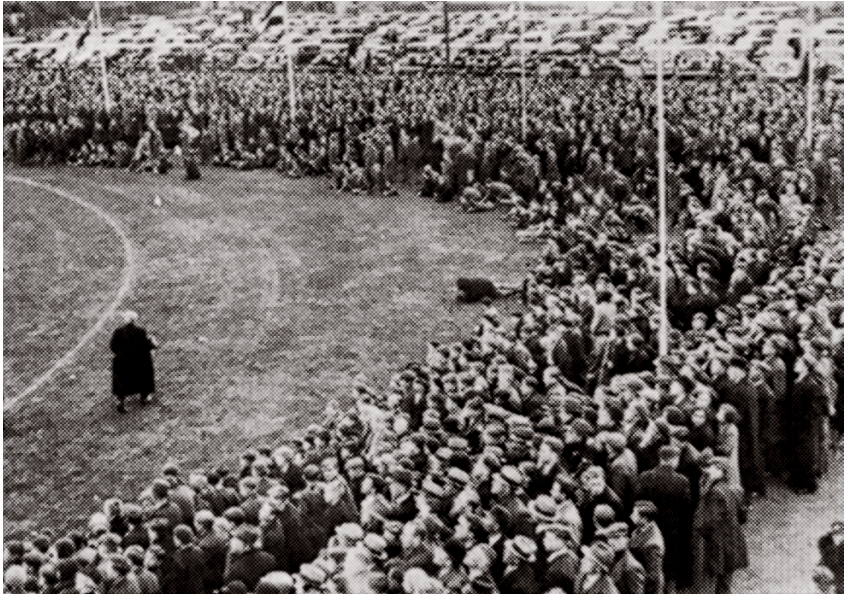
Er was grote publieke belangstelling voor de promotieduels tussen de FC Hilversum en 't Gooi in 1937. De foto laat een volgepakt Sportpark zien.

ties bij verschillende bonden. Op het voetbalveld werden dus geen oorlogen tussen de zuilen uitgevochten.