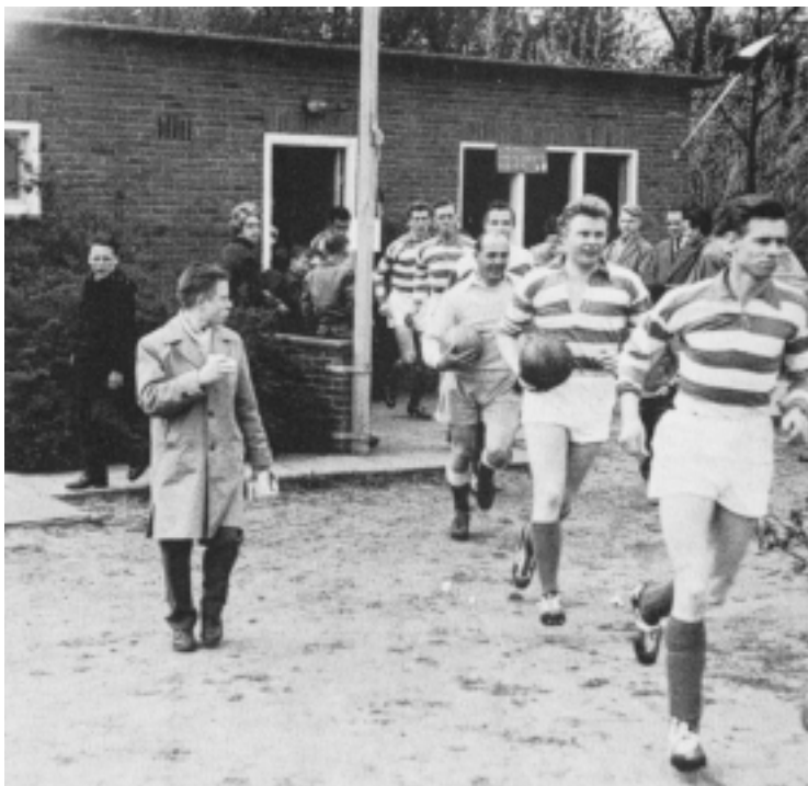
Een elftal van de Zebra's in de jaren zestig verlaat de kleedkamer. De commercie was nog niet tot het voetbal doorgedrongen. De shirts waren nog zonder reclame. (uit: 50 jaar Zebra's)

Hilvert spelen. Aanvankelijk speelde men in de kleuren zwart-wit. Toen men echter via de keeper van het Amsterdamse Blauw-Wit, Herman van Raalte, blauw-wit gestreepte shirts kon kopen, werden dit de clubkleuren.