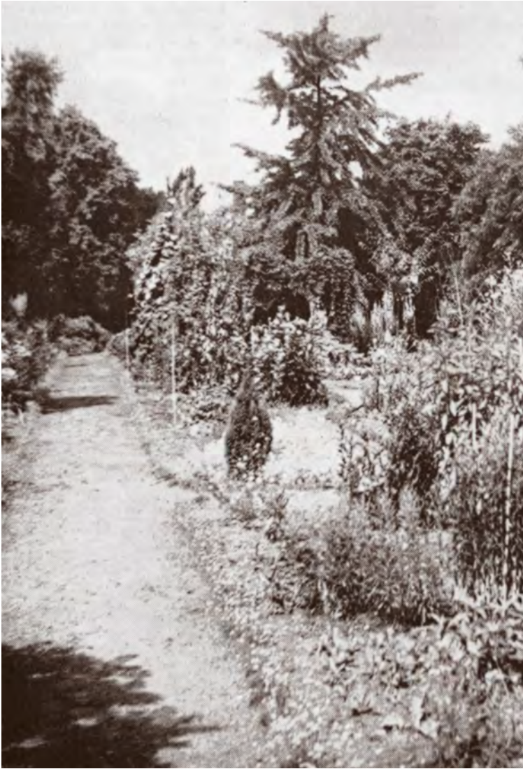
De tuin in de zomer van 1961.

Daar stond tegenover dat de huur van de gemeentegrond al direct verlaagd was van 175 naar slechts één gulden per jaar.