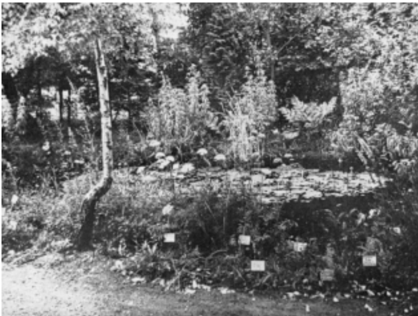
Romantische hoek in de Costerustuin van inlandse water- en moerasplanten. Op de achtergrond de Koningsvaren duidelijk zichtbaar.

Ruim een kwart eeuw later bestaat de 1250 vierkante meter grote Botanische Tuin Dr. Costerus nog steeds. De toegang is vrij, maar niet voor honden. Voor