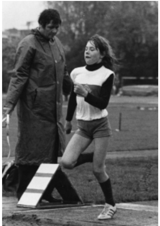
Eén van de pupillen-A in actie tijdens wedstrijden in Den Haag op 26 mei 1979.