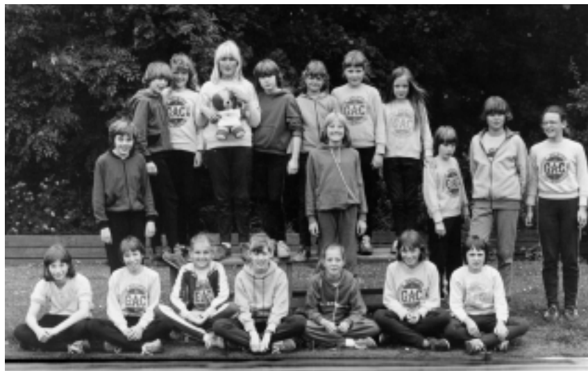
De voltallige meisjes-D-ploeg die deelnam aan wedstrijden in Utrecht op 7 juni 1980.