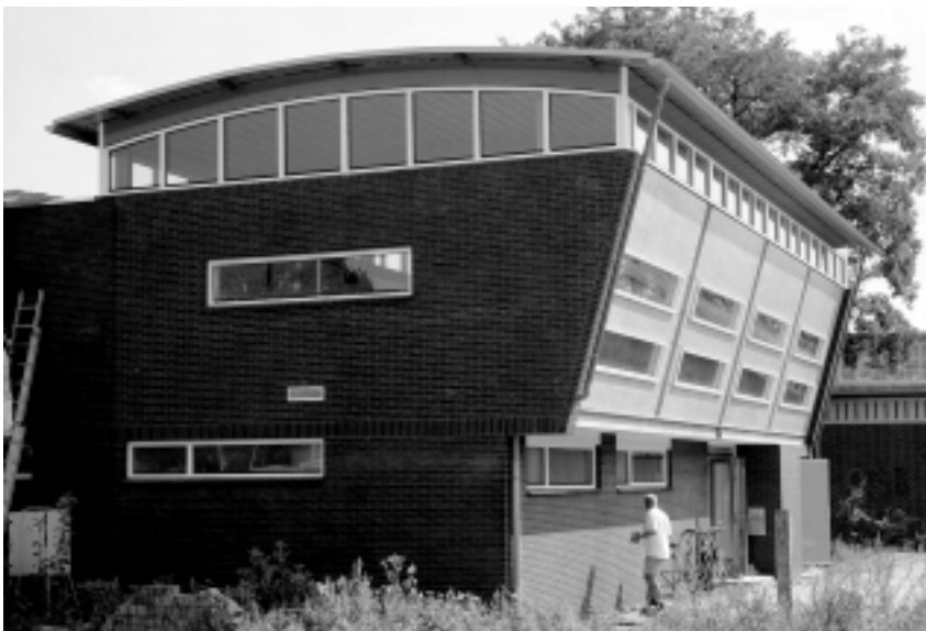
Het ter gelegenheid van het jubileum werd het clubhuis op het Sportpark aan de Soestdijkerstraatweg opgeknappt en uitgebreid.

Ach ja, en zo ben ik van 1962 tot 1980 trainer geweest. En wat denk ik er vaak met genoegen aan terug. En vooral: wat zijn al die dames en heren op den duur ver gekomen. Wie vermoedde onder die zuchtende mannen van de herfst in 1962 marathonlopers? Wie vermoedde toen dat die zaterdagochtenden in het bos zulke belevenissen zouden worden?