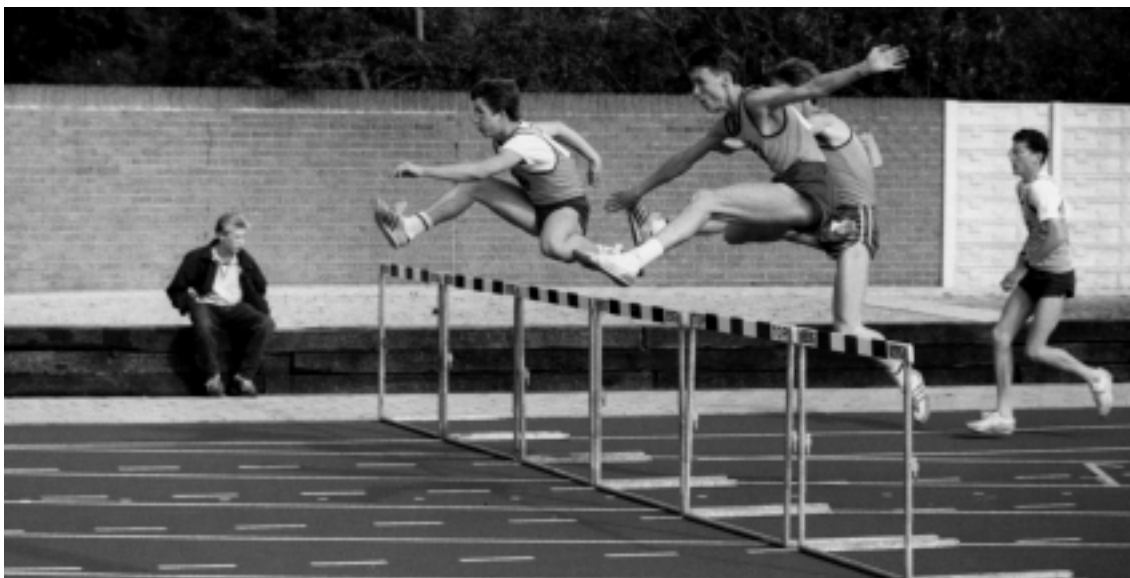
Actiefoto genomen tijdens de clubkampioenschappen op 3 en 4 oktober 1987.

finale van het landelijk clubkampioenschap mee. In de loop der jaren behaalden veel GAC-junioren, zowel meisjes als jongens, districtscompetities, zoals de reeds genoemde, maar ook vele andere, echter te veel om op te noemen, dus moeten we ons beperken tot nationale jeugdtitels op gevaar af dat we wel eens iemand vergeten.