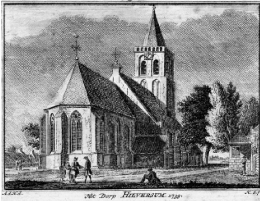
Ingekleurde gravure van de Kerk aan de Kerkbrink in 1739, gemaakt door H. Spilman naar een origineel van H. de Haen.

bevestigen dit beeld. Zowel bij de verkiezing van kerkenraadsleden als de benoeming van dorpsbestuurders circuleerden vaak dezelfde namen. De één kwam wat meer voor in de kerkenraad; de ander bezette wat vaker een zetel in het dorpsbestuur. Sommigen komen we in beide colleges tegen.