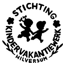
De Expohal in 1972, 'Hilversum's grootste overdekte speeltuin'.

Voor technisch aangelegde scholierijtes staan in de Expohal modeldozen klaar,