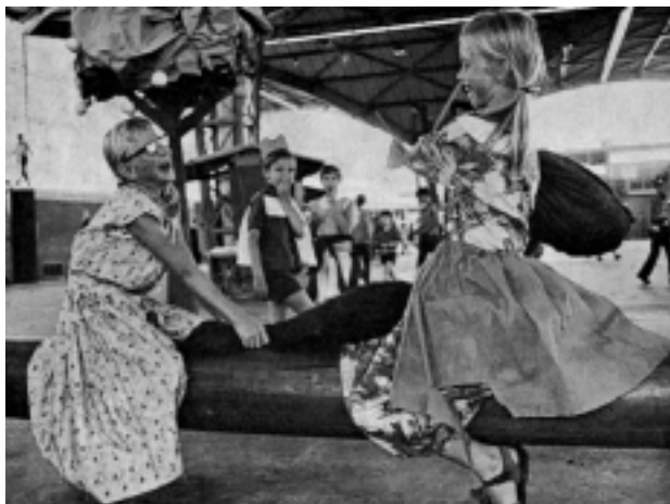
Twee bezoektjes aan de Expo-instuif van 1969, ontwikkeld in een heftig kussen-gevecht.

De Expo-instuif blijft intussen de grote publiekstrekker van het kindervakantiewerk. En ieder jaar komen er weer nieuwe onderdelen bij. In de zomer van 1969 is dat bijvoorbeeld een redactielokaal,