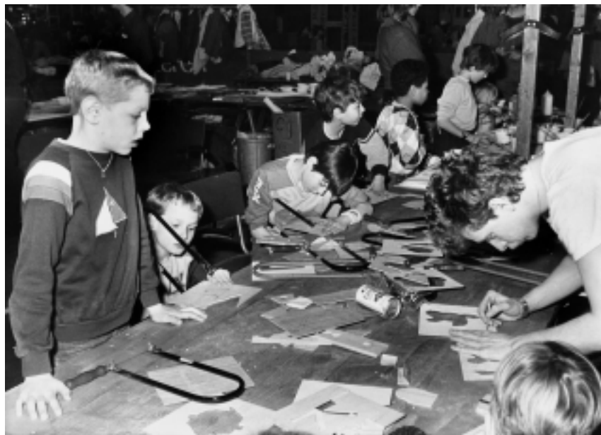
Figuurzagen tijdens het Kindervakantiefestival van 1985.