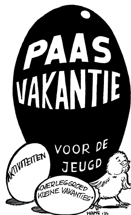
Tekening van Hans van Gorkom voor een advertentie voor de paasactiviteiten '74.

De daaropvolgende jaren ontwikkelt het Hilversumse Kindervakantiewerk zich verder. De belangrijkste veranderingen op een rijtje. Het Bonanzadorp wordt in 1970 een zelfstandig onderdeel (als Evenementenweek), en vindt onderdak in de 'Bijlardhal' aan de Prins Bernhardstraat. Een jaar later zijn het Bonanzadorp en het Jeugdcircus in de Feesthal aan de Vaartweg. Het circus Fakantia trekt in 1972 voor het eerst door Hilversum, om in vijf verschillende wijken telkens twee voorstellingen te geven. Het Matawit-terrein is vervolgens (vanaf '73) de locatie voor de Evenementenweek. In 1974 wordt de Expo-instuif –