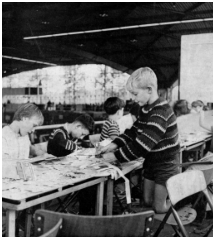
Knutselen met schaar en karton tijdens de allereerste Expo-instuif, die in augustus 1966 plaatsvond.

Het vakantiewerk is verdeeld over een aantal lagere scholen. Als 'verzamelpunten' fungeren onder meer de Valerius-, Huygens-, J.P. Thijsse-, Thorbecke- en Hugo de Groot-school. Maar ook het jeugdgebouw van de H. Hartparochie en