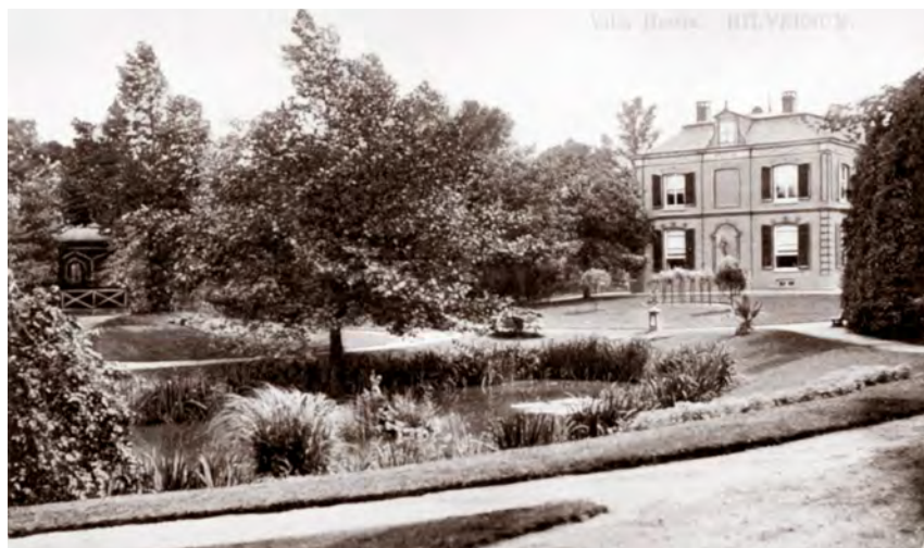
Villa Hestia op een Ansichtkaart in het begin van de 20e eeuw (coll. Goois Museum)