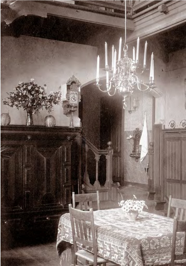
De Hall van het internaat.