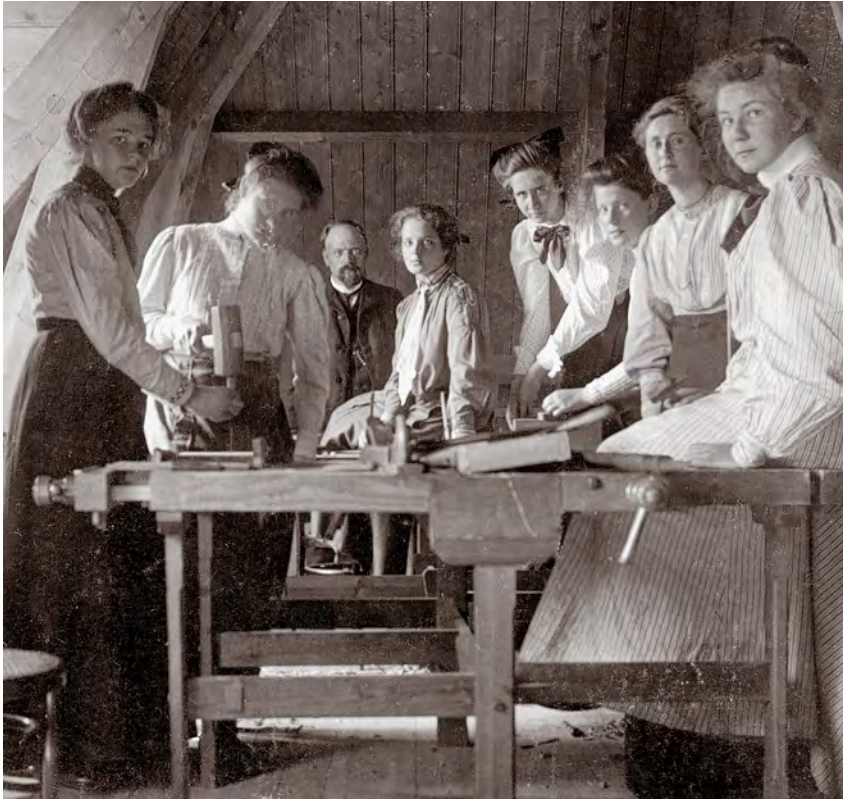
Slöjdlés aan de meisjes van de middelbare opleiding in 1906. (coll. Streekarchief)

Over de periode 1901-1913 worden de resultaten van de school zeer precies weergegeven in het Gedenkboek Hilversum 1424-1924: In die jaren legden 14 leerlingen met succes het Staatsexamen af, 22 hebben later de akte A voor een der moderne talen verworven, 9 hebben een diploma op de school voor Maatschappelijk Werk verkregen, 8 behaalden een diploma voor handarbeid, 1 een diploma voor tuinbouw, 1 voor nuttige handwerken, 1 verkreeg een betrekking op een bankierskantoor, 1 werd verpleegster, terwijl 15 der oud-leerlingen zich wijdden aan de kunst. Misschien toch nog niet zo'n slecht resultaat voor een middelbare meisjesschool die haar leerlingen vooral opleidde tot goede echtgenotes en moeders.