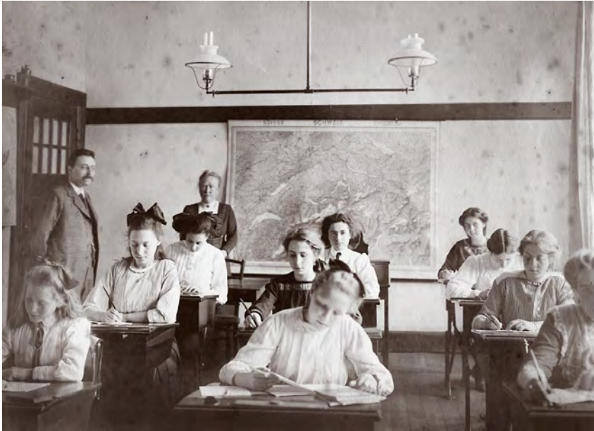
Een klas van de middelbare school in het oude gebouw. Achterin de klas staat de directrice, links een onbekende docent.