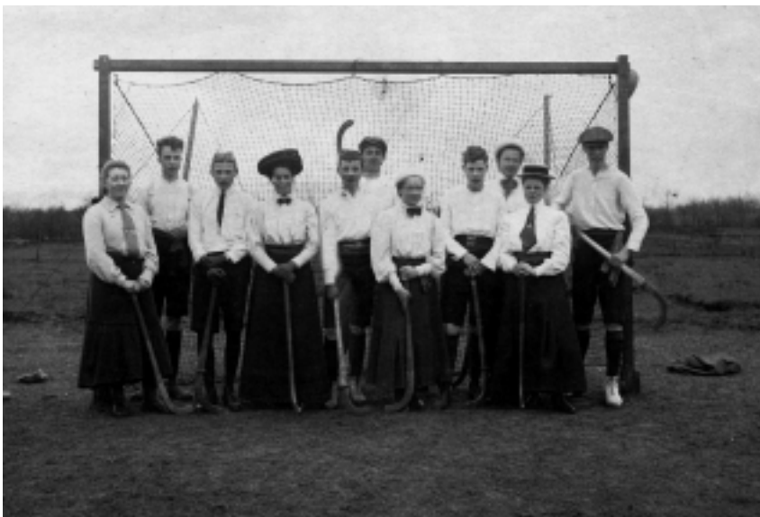
De Godelinde Mixed Hockeyclub in maart 1907. De mannelijke hockeyers werden betrokken uit andere internaten in de buurt, zoals van het internaat van Van Hingst.

De Godelinde Mixed Hockey Club werd opgericht vanuit het internaat, maar be-