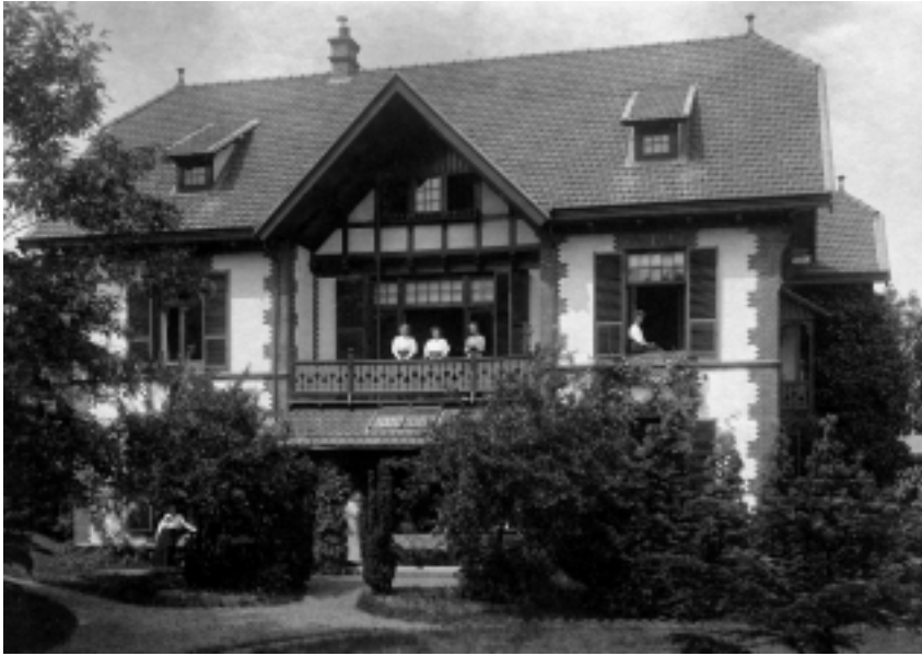
Het internaat aan de Ceintuurbaan, nr 1.