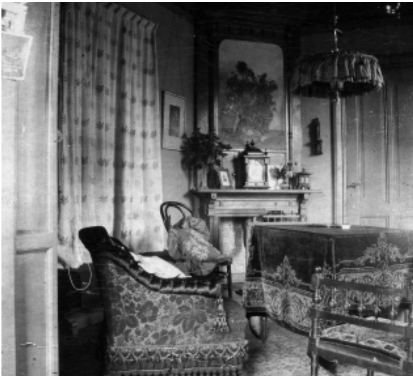
De kamer van de barones in het internaat, in 1901.