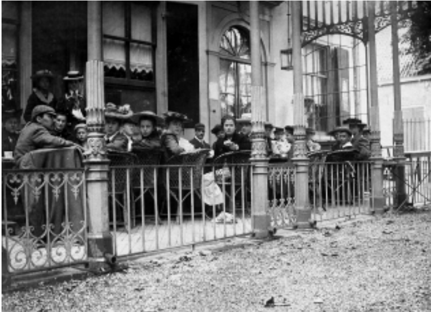
De 'Internen' uitpuffend op een terras na de fietstocht naar Zeist.

het aantrekken ervan behulpzaam zijn. Nadat de jongeren onder hevig mopperen nog naar hogere sferen waren verhuisd, bleven de ouderen van dagen napraten.