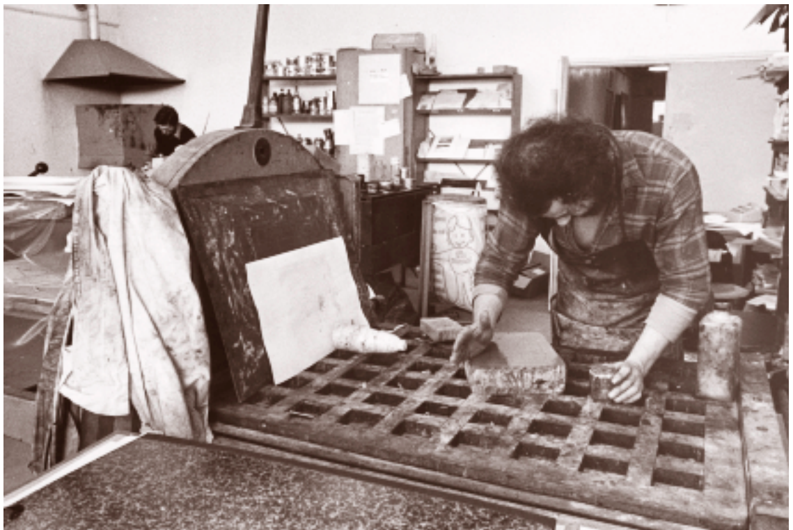
Een lithograaf aan het werk in 1978.